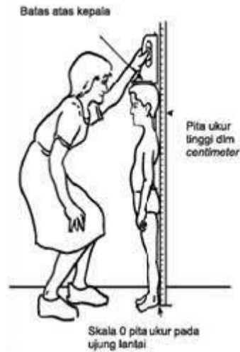
Gambar 1. Cara Pengukuran Tinggi Badan

Gambar 1 dan gambar 2 berikut merupakan cara mengukur tinggi badan dan panjang badan (Majestika Septikasari, 2018).