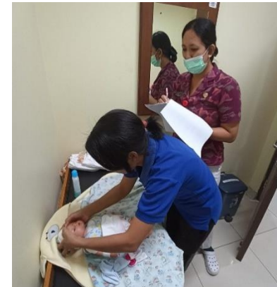
Mengobservasi cara pijat bayi menggunakan lembar cek list