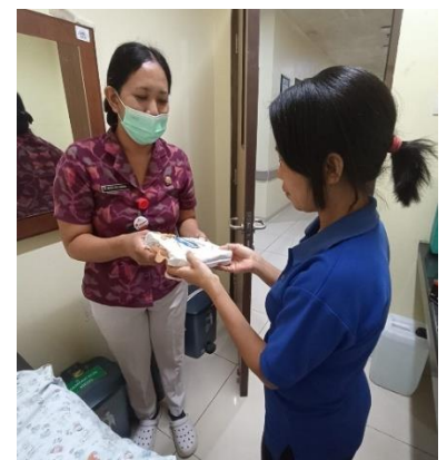
Mengucapkan terimakasih serta memberikan bingkisan baby kit