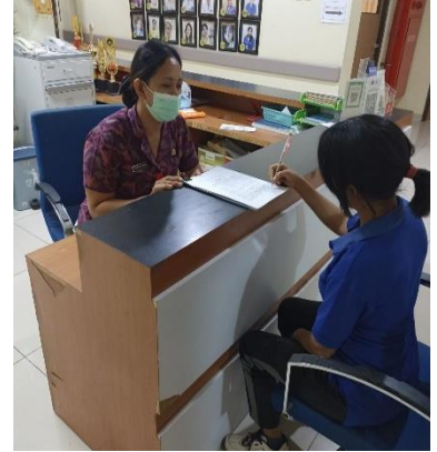
Melakukan informed consent dan pengisian kuisioner