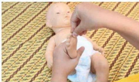
Gambar 4. Stimulasi Pijatan kaki

Melakukan stimulasi pijatan pada jari kaki dengan memijat lembut setiap jari kaki satu persatu menuju ke arah ujung jari dengan gerakan memutar dan mengakhirinya dengan tarikan lembut pada tiap ujung jari kaki.