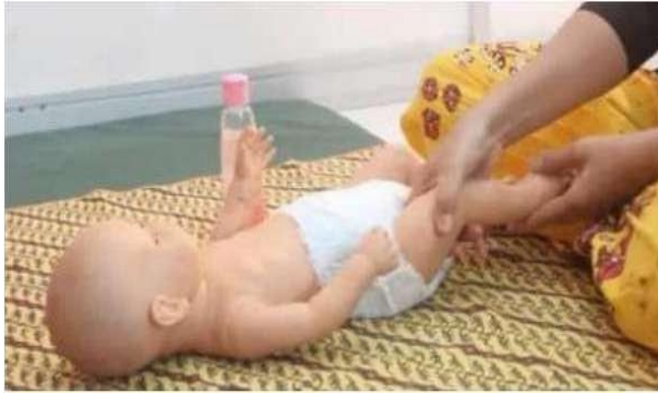
Gambar 1. Pijatan Memerah