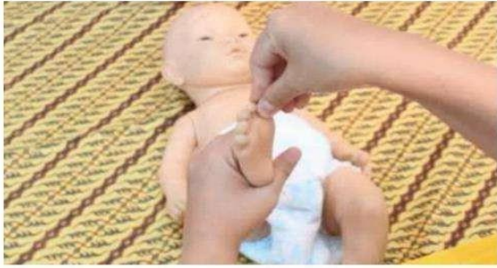
Gambar 5. Rileksasi