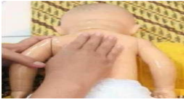
Gambar 19. Pijat menggaruk

Melakukan stimulasi pijatan menggaruk dengan membuat belaian memanjang dari leher menuju bokong dengan menggunakan kelima ujung jari tangan kanan atau kiri. Lakukan gerakan ini beberapa kali.