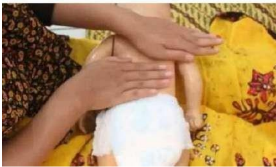
Gambar 15. Pijatan maju mundur

Melakukan pijatan maju mundur dengan cara menengkurapkan anak melintang di depan pemijat dengan kepala di sebelah kiri dan kaki di kanan pemijat. Letakkan telapak tangan tegak lurus terhadap tulang punggung anak kemudian lakukan gerakan maju mundur di sepanjang punggung dari leher sampai ke bokong.