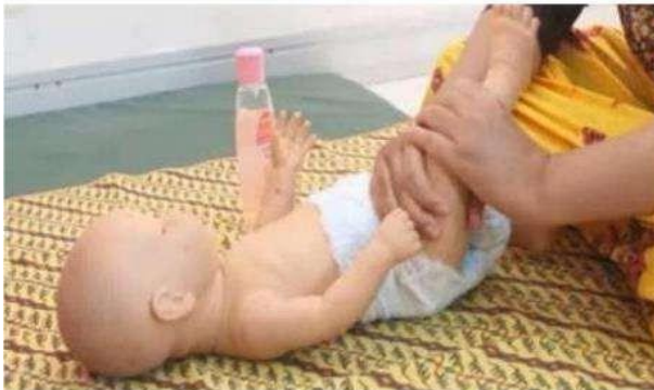
Gambar 2. Pijatan Memeras

Melakukan stimulasi pijatan memeras dengan memutar dan memeras secara lembut dari pangkal paha ke pergelangan kaki dengan kedua tangan.