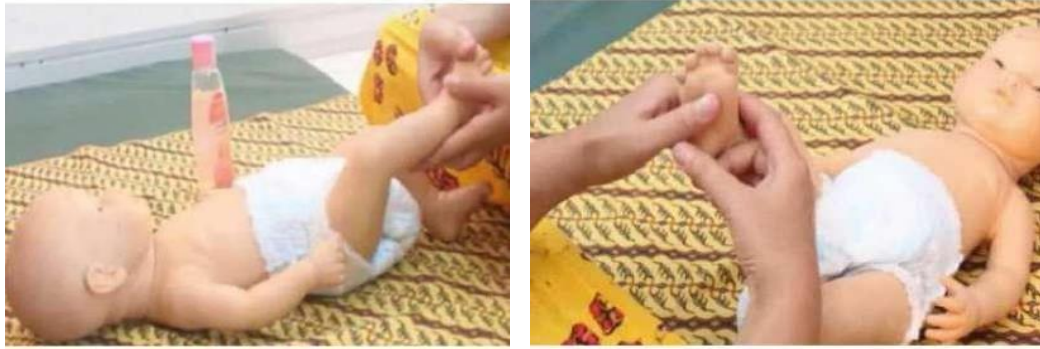
Gambar 3. Pijat Telapak dan Punggung kaki