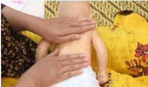
Gambar 17. Pijat Mengayuh

Melakukan stimulasi pijatan mengayuh dengan meletakkan telapak tangan tegak lurus terhadap tulang belakang kemudian gerakkan ke kanan ke bawah dengan tekanan lembut sampai bokong.