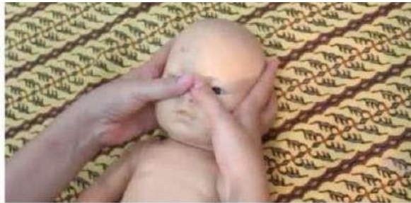
Gambar 13. Stimulasi pijat bayi

Memijat dari kedua sudut mata bagian dalam melewati pangkal hidung sampai tulang pipi dengan menggunakan ibu jari.