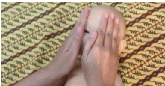
Gambar 11. Usap muka

a) Usapan muka - Mengusap wajah dimulai dari garis tengah wajah ke arah telinga dengan penuh kasih sayang.