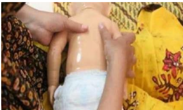
Gambar 18. Pijat melingkar

Melakukan stimulasi pijatan melingkar dengan membuat gerakan melingkar kecil di sepanjang otot punggung mulai dari bahu sampai bokong sebelah kiri dan kanan tulang belakang dengan menggunakan ibu jari atau tiga jari (jari telunjuk, jari tengah, dan jari manis).