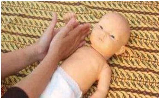
Gambar 10. Stimulasi pijat menggulung

Melakukan stimulasi pijatan menggulung dengan cara membuat gerakan seperti menggulung dengan kedua telapak tangan mulai dari pangkal lengan menuju pergelangan tangan.