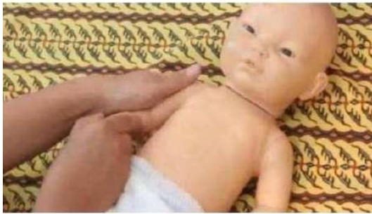
Gambar 9. Stimulasi pijatan memerah