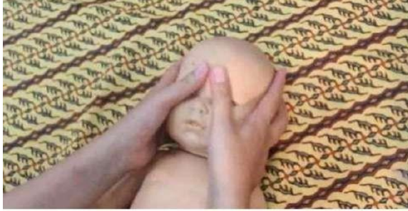
Gambar 12. Stimulasi pijat alis

Memijat daerah di atas alis dari samping menggunakan kedua ibu jari