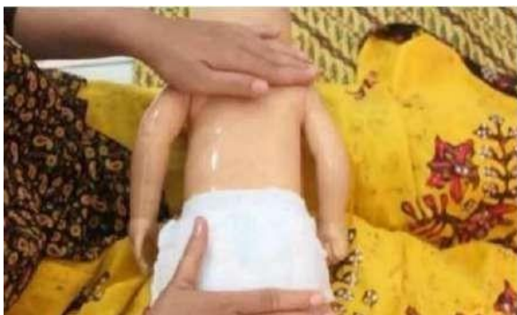
Gambar : 16 Pijatan meluncur

Melakukan stimulasi pijatan meluncur dengan memposisikan telapak tangan tegak lurus terhadap tulang punggung anak, gerakkan telapak tangan lurus dari atas ke bawah dari leher sampai bokong.