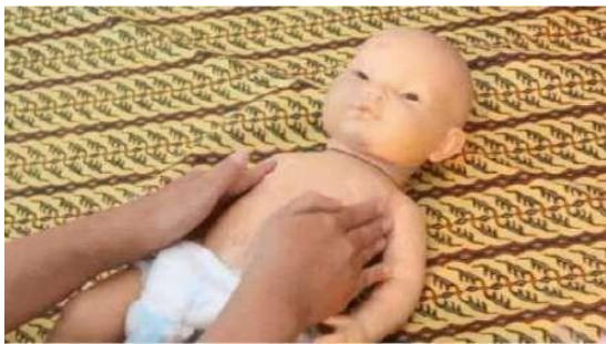
Gambar 8. Stimulasi pijatan kupu-kupu

Meletakkan kedua telapak tangan di tengah dada, kemudian gerakan ke dua tangan ke atas sampai di bawah leher kemudian ke samping, ke bawah dan kembali ke tengah tanpa mengangkat tangan menyerupai sayap kupu-kupu.