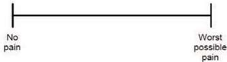
Gambar 2 Visual Analogue Scale (VAS)

bagian garis yang menggambarkan tingkat nyeri yang dirasakan. Nilai intensitas nyeri diperoleh dengan mengukur jarak dari titik awal hingga tanda yang dibuat pasien dalam satuan sentimeter.