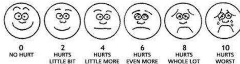
Gambar 3 Wong Baker Faces Pain Rating Scale

FPRS umumnya diterapkan pada anak usia di atas 3 tahun, lanjut usia, maupun pasien yang mengalami kesulitan berkomunikasi. Skala ini menampilkan enam ilustrasi ekspresi wajah yang menunjukkan tingkatan nyeri, mulai dari wajah ceria yang menandakan tidak nyeri sampai wajah menangis yang menggambarkan nyeri berat. Setiap gambar memiliki rentang skor antara 0 hingga 10.