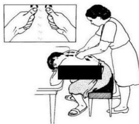
Gambar 2 teknik melakukan pijat oksitosin pada ibu nifas

juga dengan menggunakan bantal. Bidan atau suami memijat punggung ibu mulai dari belakang tepatnya pada tulang belakang leher sampai sepanjang tulang belakang. 3 Bidan atau suami mulai memijat ibu dengan menggunakan ibu jari atau kepalan tangan yang dianggap paling nyaman untuk ibu. 4. Pemijatan dapat dilakukan dengan cara gerakan memutar membuat pola lingkaran kecil, dilakukan secara pelan-pelan dari arah atas hingga mencapai garis bra, bisa juga dilanjutkan sampai pinggang. Umumnya pemijatan dilakukan selama 10-15 menit (Marsilia Diana, 2020)