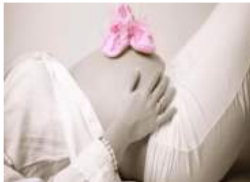
Musik Klasik Mozart ( https://youtu.be/ey3RpY-Xoiw )

https://youtu.be/V70_7CN8708?si=ljSZ17Wla0K6IVal