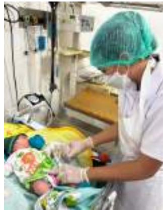
Menyuntikkan vitamin K