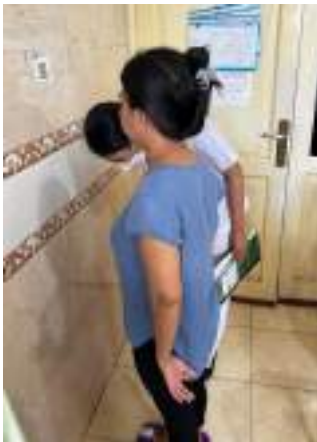
KF2 (Penimbangan berat badan)