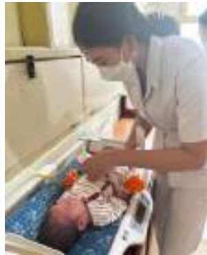
Pengukuran lingkaran perut