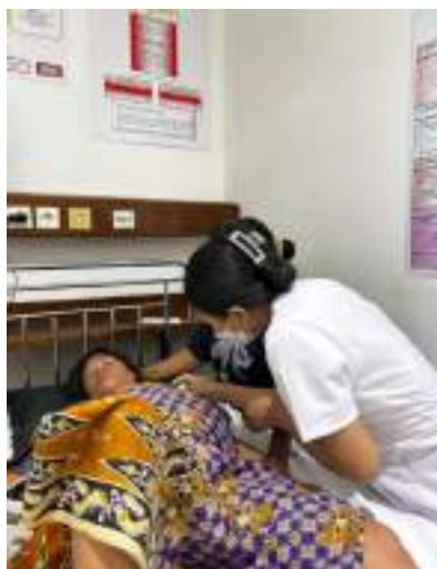
Melakukan pengukuran suhu