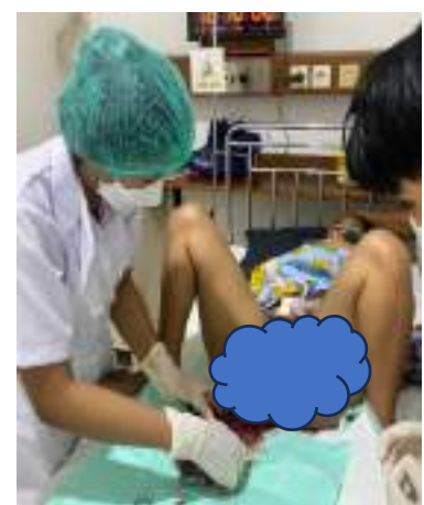
Pertolongan persalinan normal