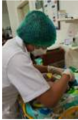
Mengukur lingkaran kepala bayi