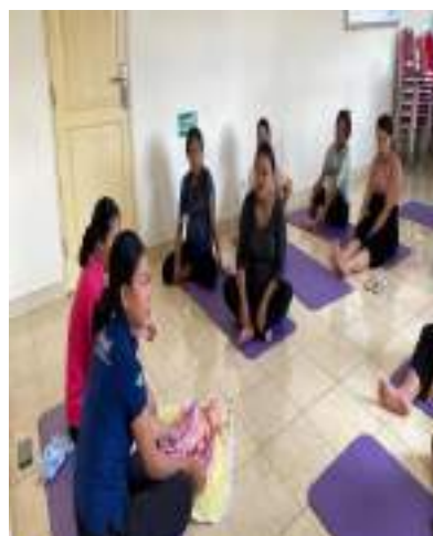
Pemberian materi pijat bayi pada kelas ibu hamil