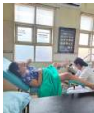
KF 4 (Pemasangan KB IUD)