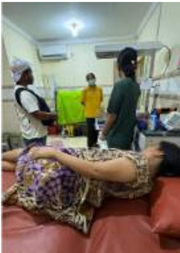
KIE Saran NST ke RS