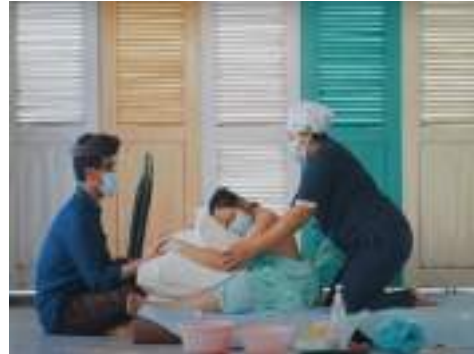
Pijat SPEOS ( https://bit.ly/4lvWk75 )