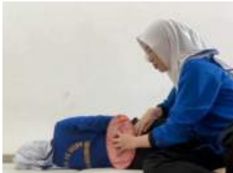
Kompres Hangat ( https://youtu.be/BVgeAJxAIH0?si=iEHCOWu_bCxOa6qM )