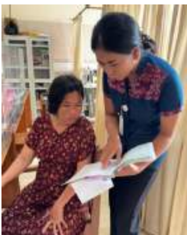
Pemberian edukasi menggunakan buku KIA