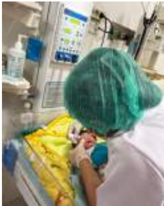
Mengoleskan salep mata