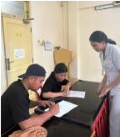
Penandatanganan persetujuan menjadi responden