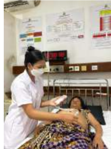
Melakukan pengukuran DJJ