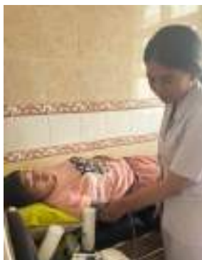
KF3 (Pengukuran tekanan darah)