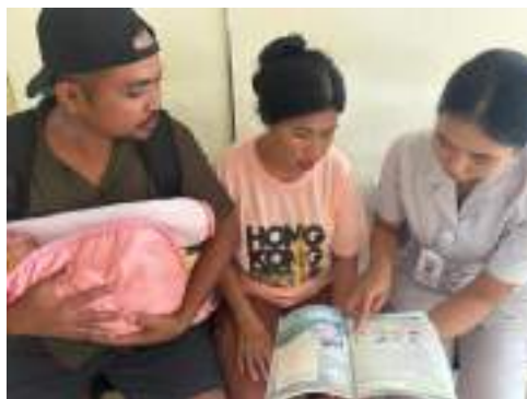
Melakukan KIE KB