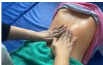
Massage Effleurage ( https://youtu.be/o65St6ZGhZM?si=2g-UsmyGrsPUECC2 )