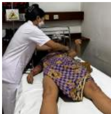
Pengukuran suhu 2 jam post partum