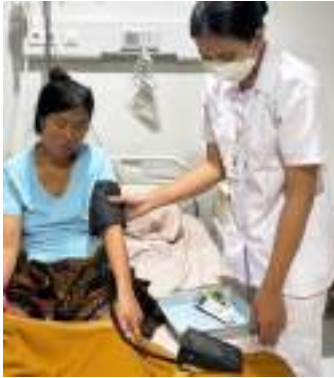
Pemeriksaan tekanan darah