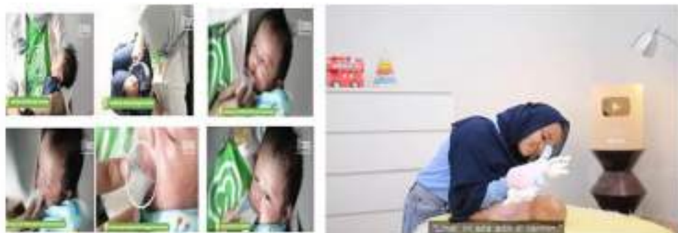
Pemberian ASI Melalui Cup Feeder ( https://bit.ly/3EqpDY1 )