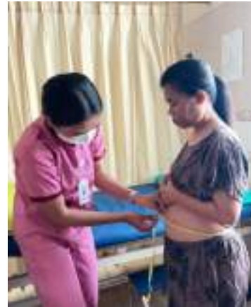
Pengukuran lingkaran perut