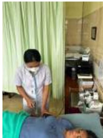
Pengukuran tekanan darah