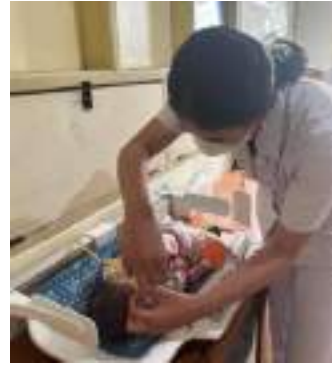
Pengukuran lingkaran kepala