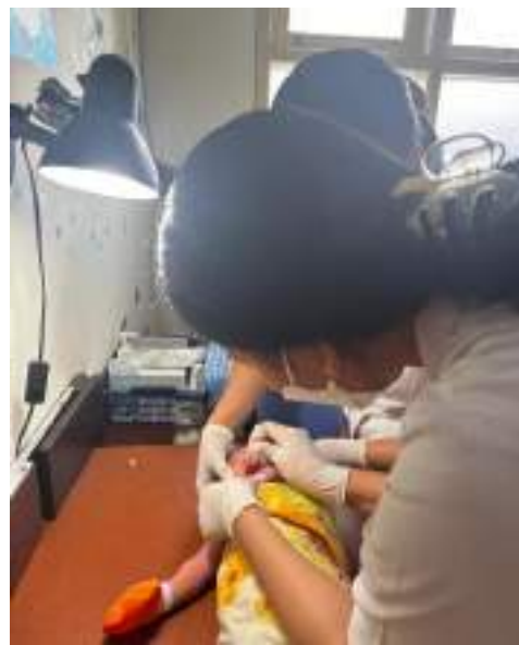
Pemberian imunisasi polio