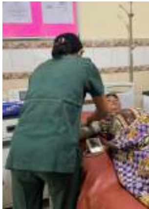
Pengukuran tekanan darah