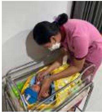
KN1 (Pemeriksaan TTV Bayi)