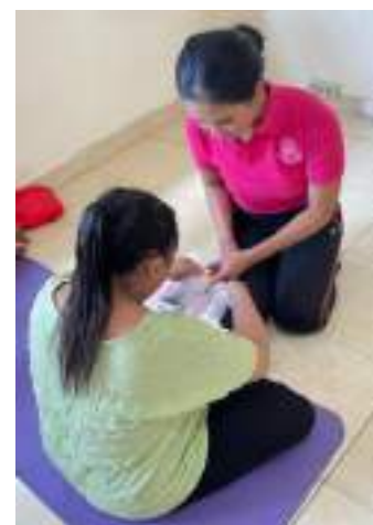
Praktek materi kelas ibu hamil yaitu perawatan