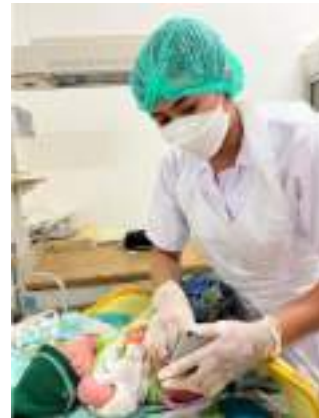
Melakukan cap kaki bayi