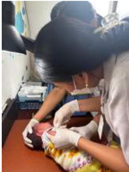
Pemberian imunisasi BCG