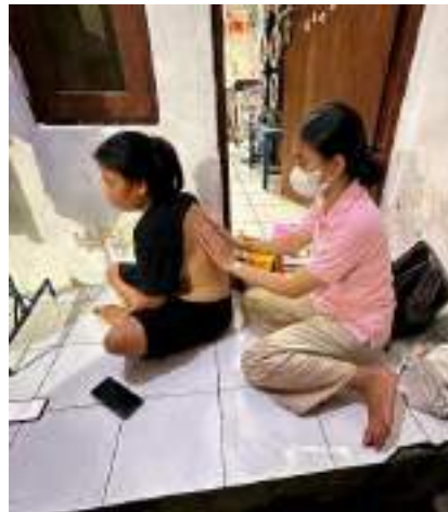
Melakukan massage effleurage saat kunjungan rumah