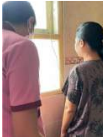
Penimbangan berat badan