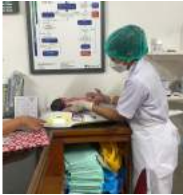
Menimbang bayi baru lahir