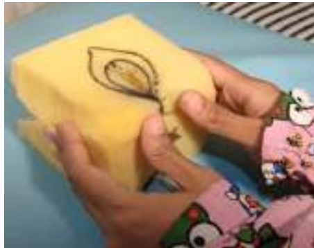
Pijat perineum ( https://youtu.be/yU43gu4vaRo )