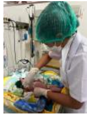
Mengukur lingkaran dada bayi