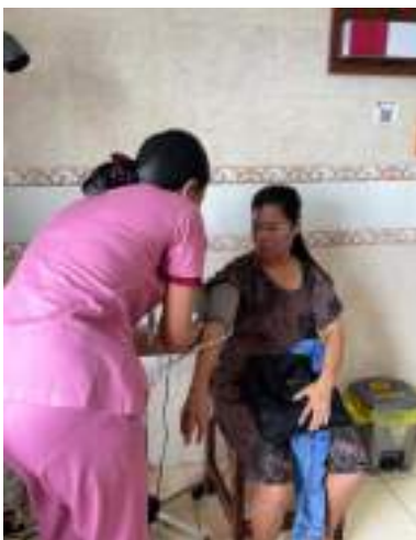
Pengukuran tekanan darah