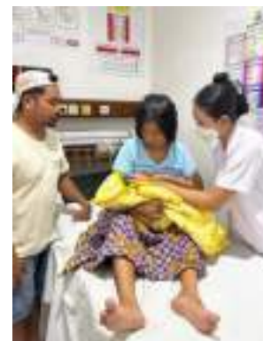
Membimbing ibu melakukan teknik menyusui