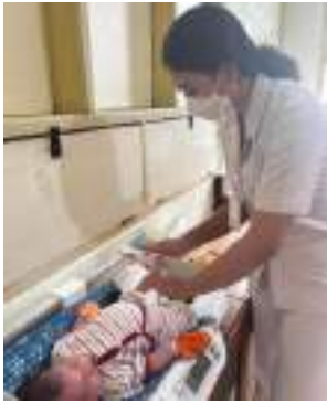
KN3 (Pengukuran berat badan dan panjang bayi)