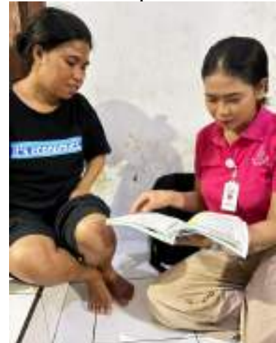
Pemberian KIE menggunakan buku KIA saat kunjungan rumah