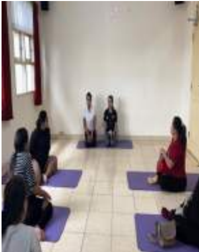
Pemberian materi kelas ibu hamil yaitu tanda bahaya kehamilan