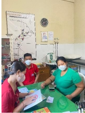
Pemeriksaan Rutin Ibu Hamil Dan Pemeriksaan Kadar Glukosa Sewaktu