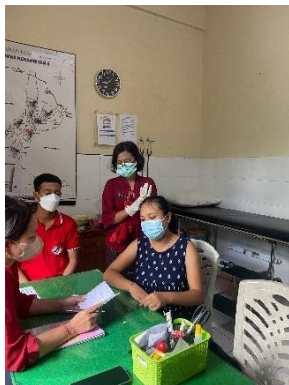
Pemeriksaan Rutin Ibu Hamil Dan Pemeriksaan Kadar Glukosa Sewaktu