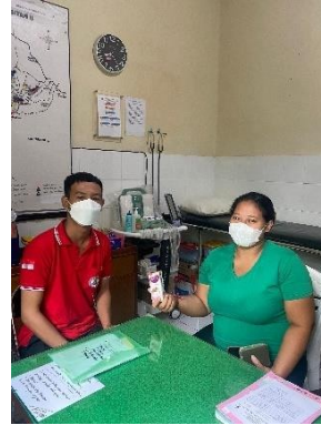
Pemeriksaan Rutin Ibu Hamil Dan Pemeriksaan Kadar Glukosa Sewaktu