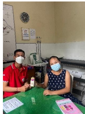
Pemeriksaan Rutin Ibu Hamil Dan Pemeriksaan Kadar Glukosa Sewaktu