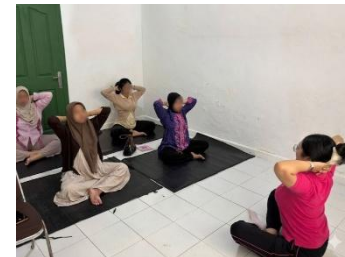
Kelas Ibu Hamil