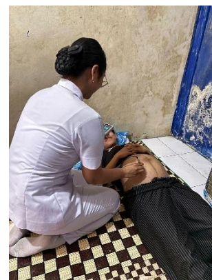
Kunjungan Rumah 3