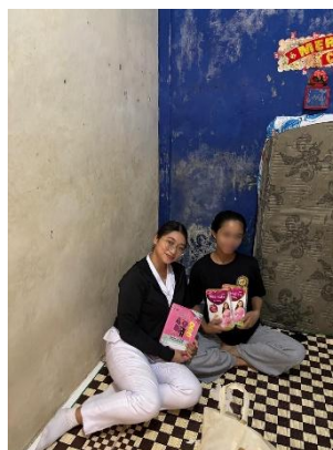
Kunjungan Rumah 2