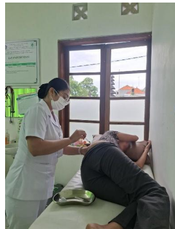
KB Suntik 3 Bulan