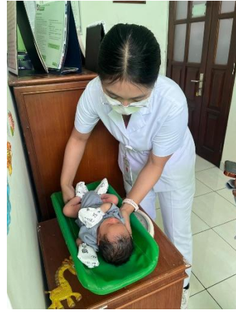
Timbang BB dan TB