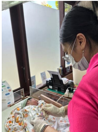
Pemberian Vitamin K