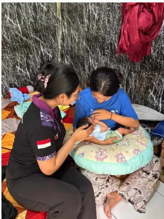
Membimbing Teknik Menyui