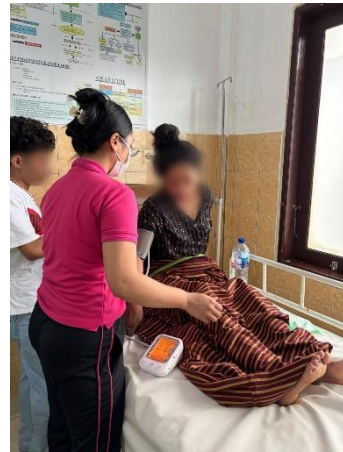
Pemantauan 2 Jam PP