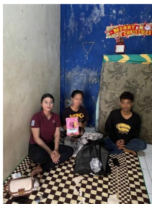
Kunjungan Rumah 1