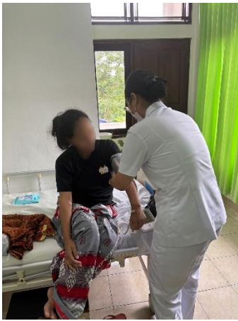
Pemeriksaan Tekanan Darah