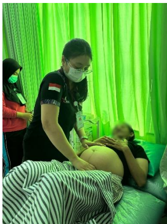
Pemeriksaan DJJ dan Presentasi