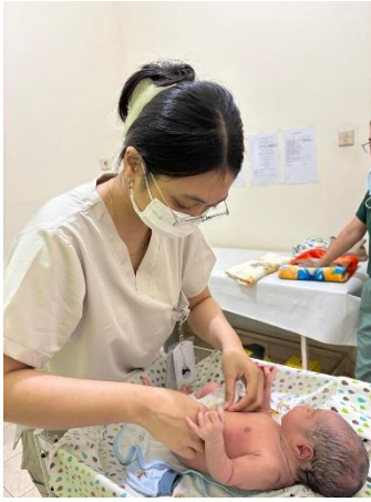
Perawatan Tali Pusat