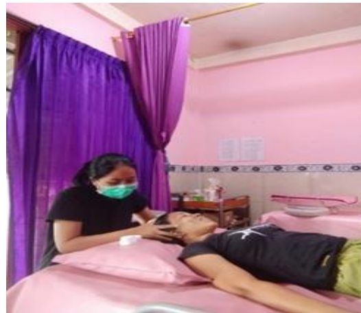
Memberikan asuhan komplementer