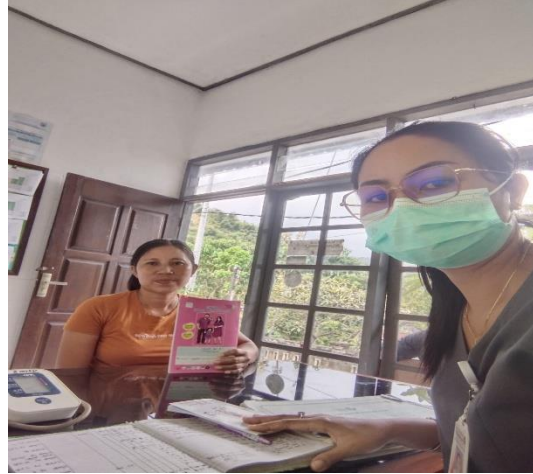
Melakukan asuhan ANC TW II