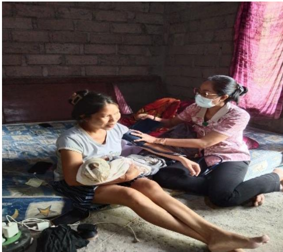
Kunjungan rumah nifas KF 3