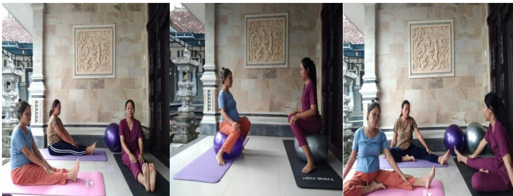
Memberikan asuhan komplementer menggunakan gym ball