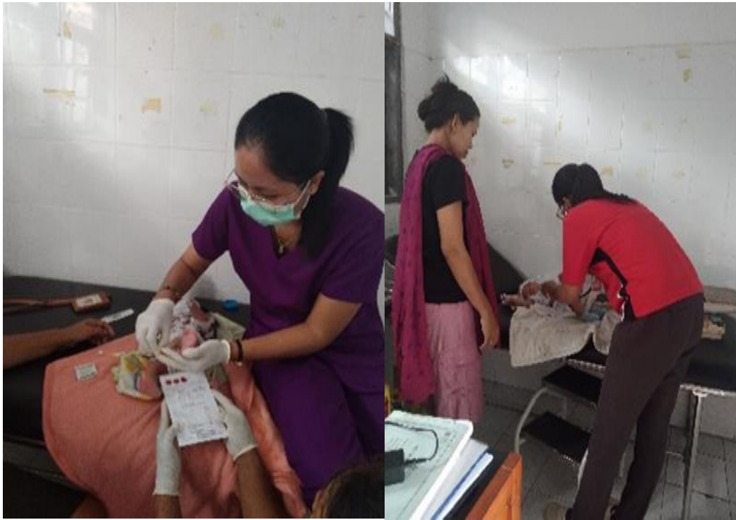
Skrining Hipotiroid Kongenital