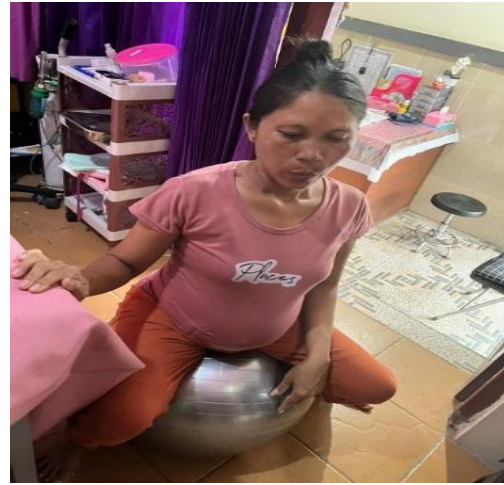
Memberikan asuhan komplementer pijat sakrum dan birth ball