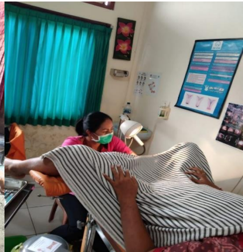
Kunjungan Nifas KF 4( pemasangan KB IUD)