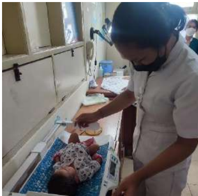
Timbang BB dan TB