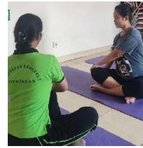
Membimbing Prenatal Yoga