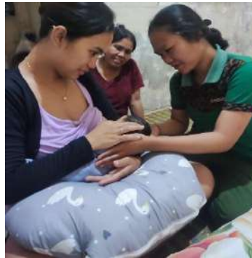
Membimbing Teknik Menyusui