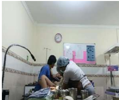
Melahirkan Kepala Bayi