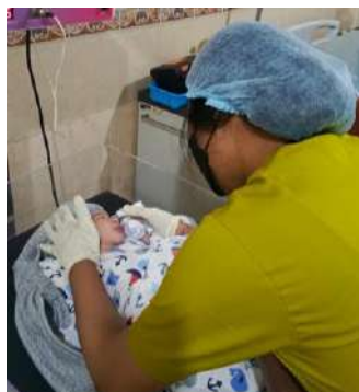
Pemberian Salep Mata