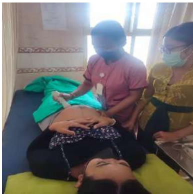
Pemeriksaan DJJ dan Presentasi