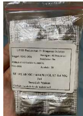
Tablet Tambah Darah