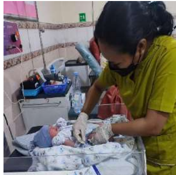
Imunisasi HB 0