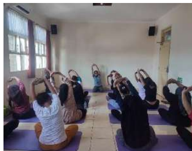
Kelas Ibu Hamil