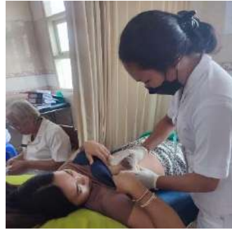
Pemeriksaan Payudara (ASI)