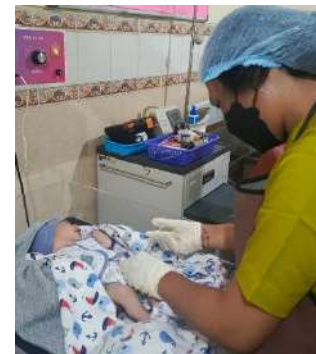
Pemberian Vit K