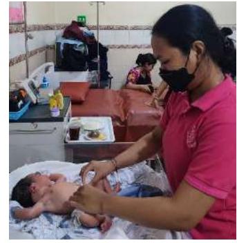
Perawatan Tali Pusat