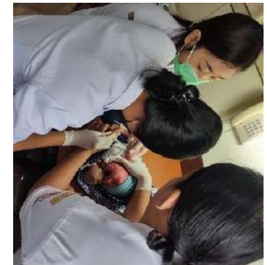
Imunisasi BCG da Polio