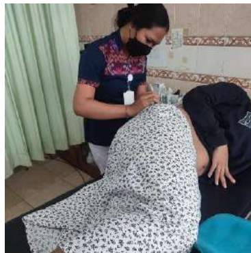
KB Suntik 3 Bulan