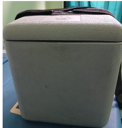
Pengiriman sampel plasma untuk pemeriksaan viral load menggunakan cool box