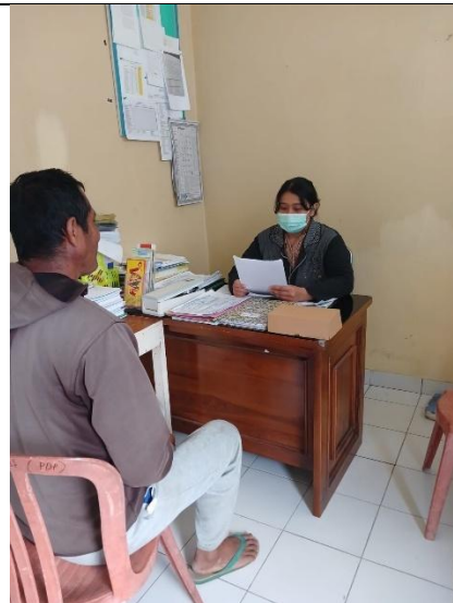
Proses pengisian informed concern dan kuisisioner MMAS-8 didampingi oleh pemegang program HIV