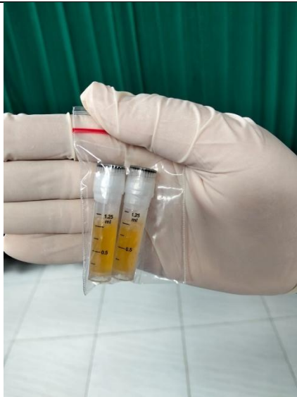
Setelah darah diambil dicentrifugasi sehingga didapatkan plasma