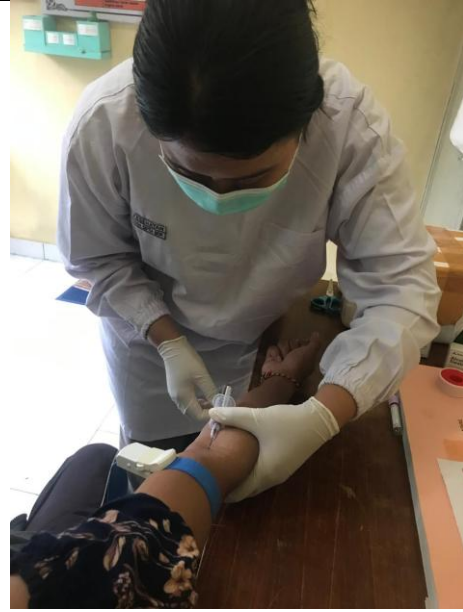
Proses pengambilan darah untuk pemeriksaan viral load