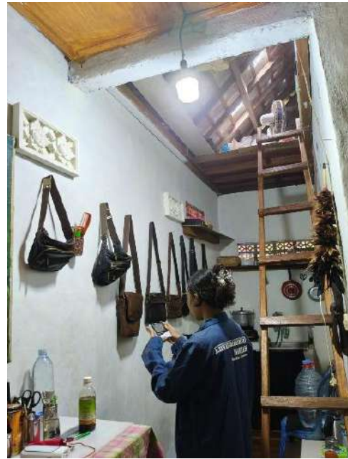
2. Mengukur kelembaban dan suhu ruang istirahat responden