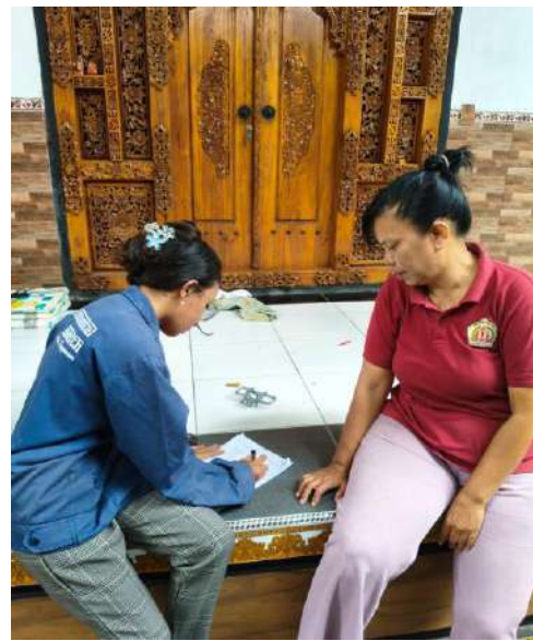
4. Mewawancarai responden dengan kuesioner yang telah disiapkan