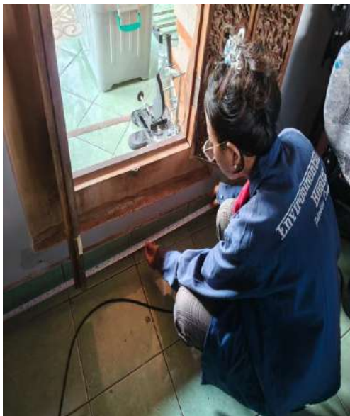
3. Mengukur luas lantai ruang istirahat responden