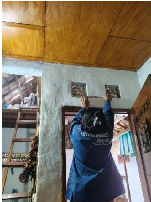
1. Mengukur luas ventilasi ruang istirahat responden