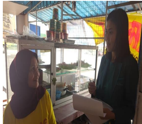
Wawancara dan Penilaian perilaku menggunakan lembar observasi terhadap responden