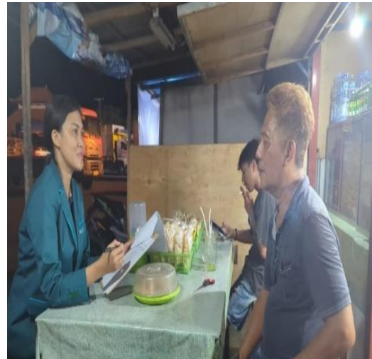
Wawancara menggunakan formulir penilaian sikap terhadap responden