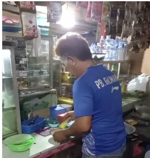
Penilaian perilaku menggunakan lembar observasi terhadap responden