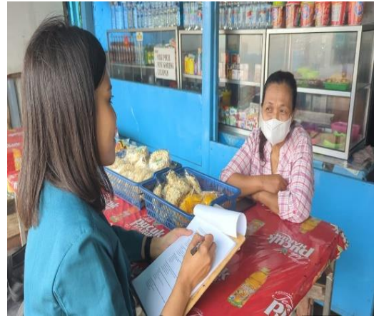
Wawancara menggunakan formulir penilaian pengetahuan terhadap responden