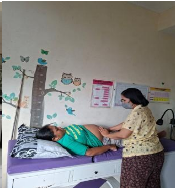
Askeb TW II