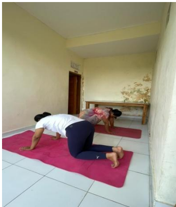
Prenatal Gentle Yoga