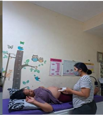
Askeb TW III