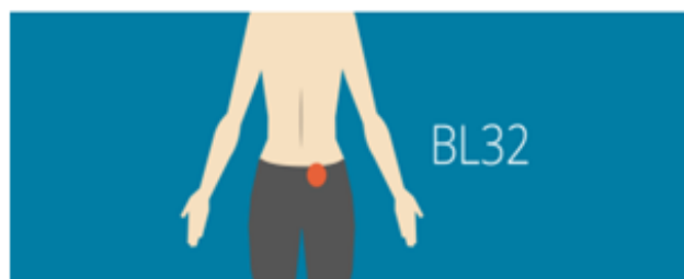
Gambar 1. Lokasi titik akupresur BL 32 (Rejeki, 2020)

1). Akupresur titik BL 32 (Pang Kuang Su). Teknik akupresur mulai dilakukan dari awal persalinan dengan menekan titik BL 32 dengan menggerakkan jari menuruni tulang belakang (kira-kira selebar ibu jari) sejalan dengan kemajuan persalinan (Rejeki, 2020).