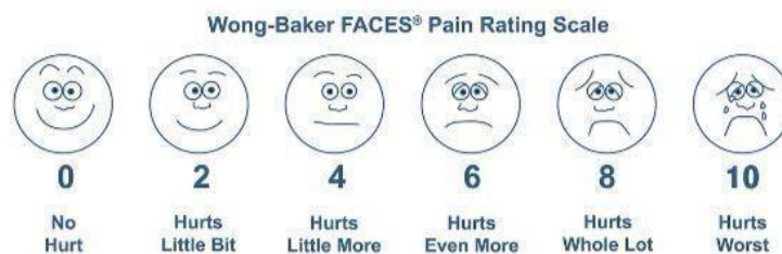
Gambar 3. Wong-Baker FACES

Penilaian dari Skala nyeri pada ekspresi wajah, Wong-Baker FACES: