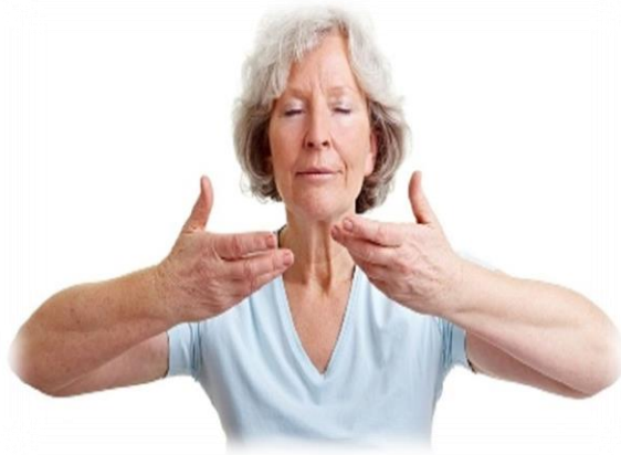
Gambar 2 Relaksasi Napas Dalam

napas secara perlahan. Relaksasi napas dalam berpotensi meningkatkan ventilasi paru-paru dan mengoptimalkan oksigenasi darah (Rindiani, 2022).