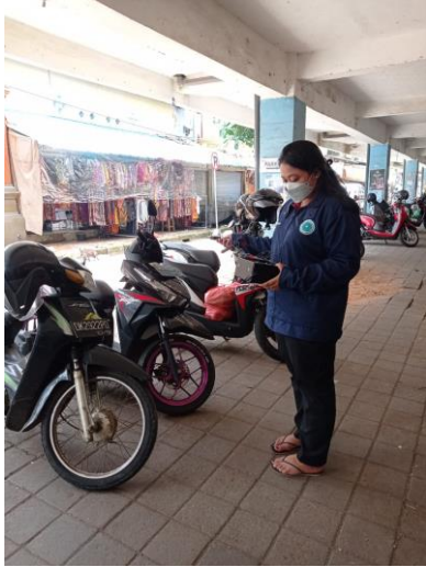
Pengukuran Pencahayaan dengan menggunakan Lux Meter