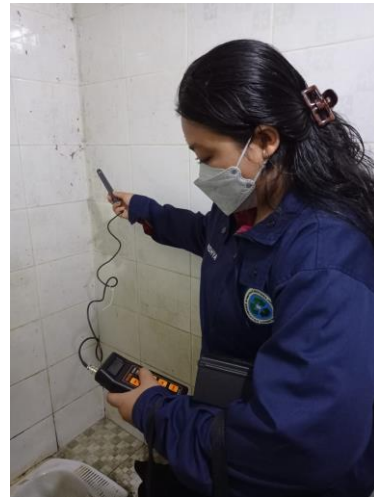
Pengukuran kelembaban dan suhu dengan menggunakan Hygrometer