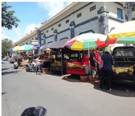
Kondisi Pedagang berjualan dipinggir jalan