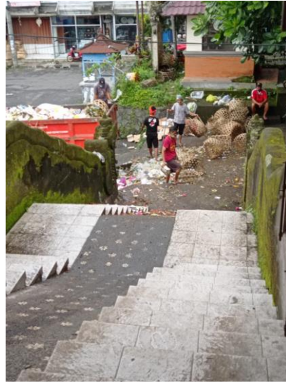
Pengangkutan sampah oleh Dinas Kebersihan