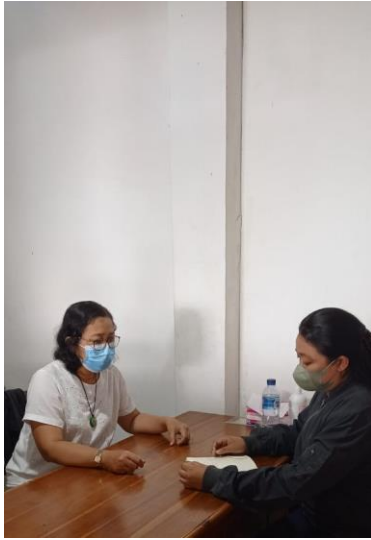
Pencarian data dengan melakukan wawancara