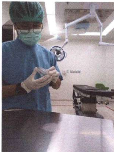
Pengambilan sampel mikrobiologi udara