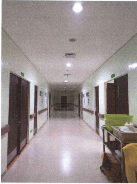
Ruang Operasi RS Mata Bali Mandara