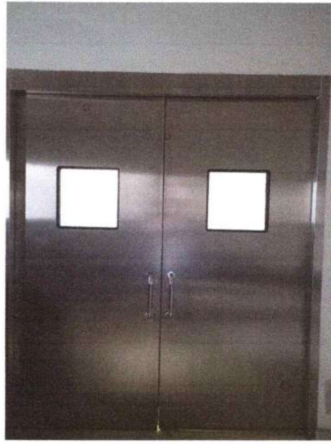
Ruang Operasi RS Mata Bali Mandara