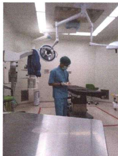
Pengambilan sampel mikrobiologi udara