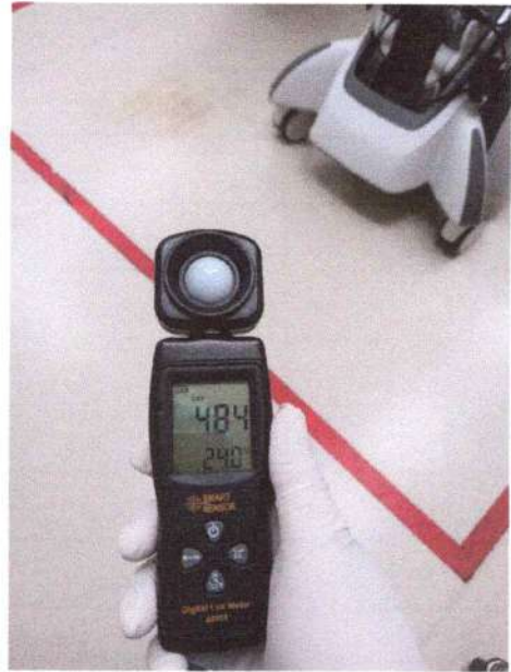
Alat ukur pencahayaan (lux meter)