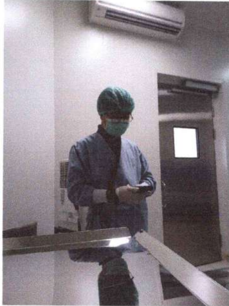
Pengukuran pencahayaan ruang operasi