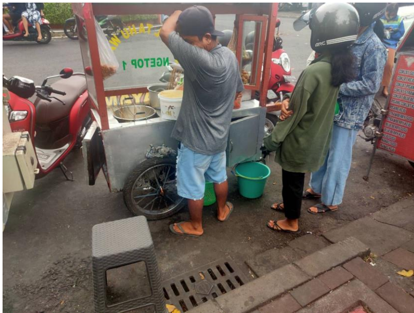
Salah satu perilaku kurang baik responden