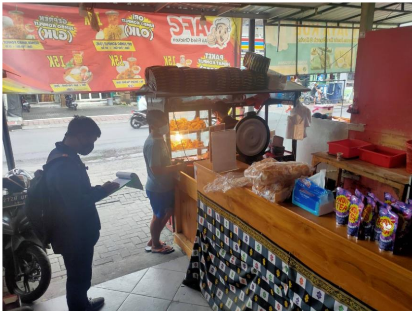
Observasi perilaku responden