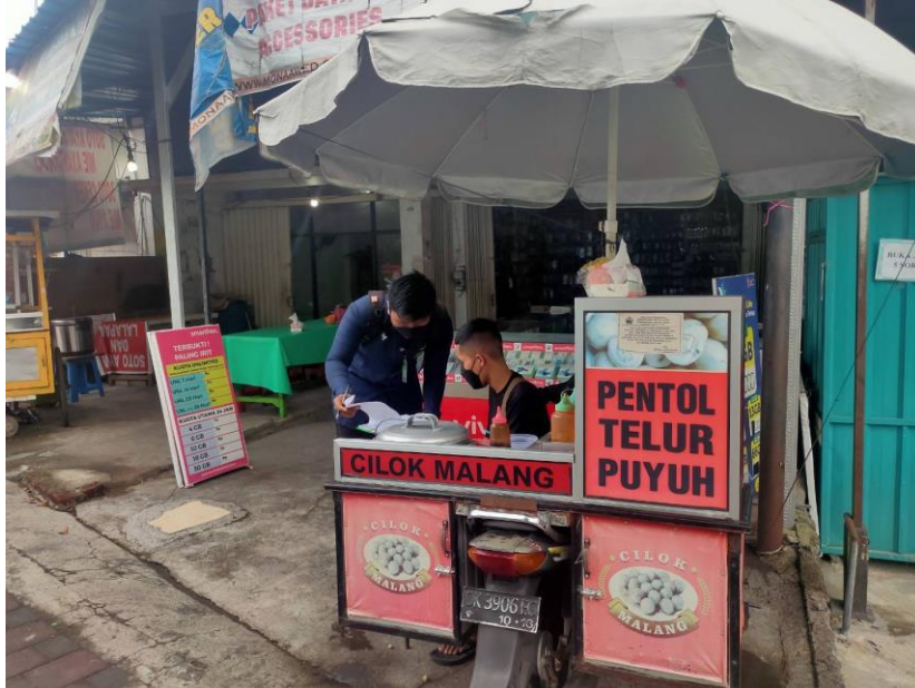
Penjelasan mengenai pengisian kuesioner