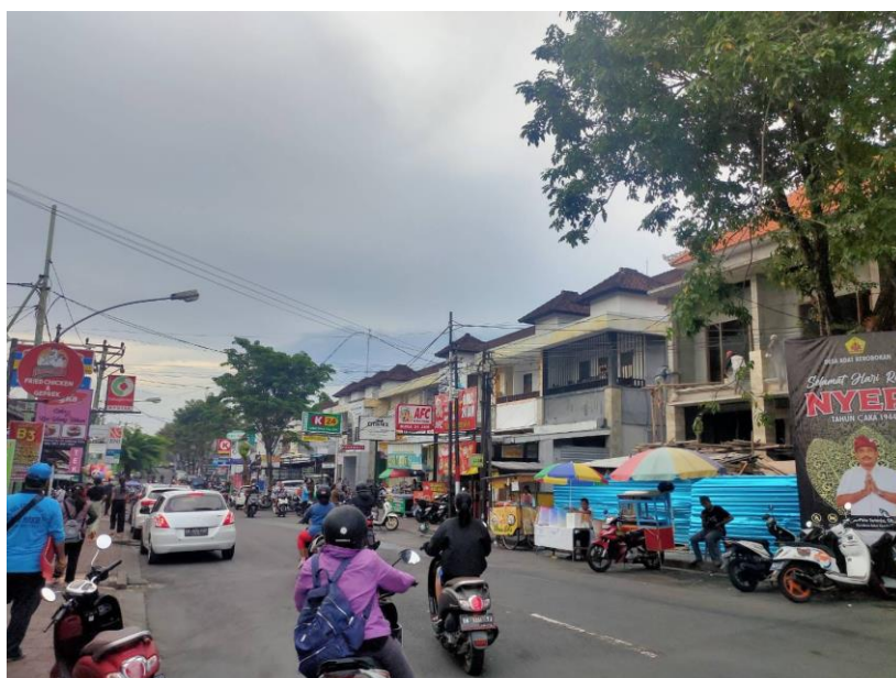
Beberapa pedagang makanan di Desa Dalung