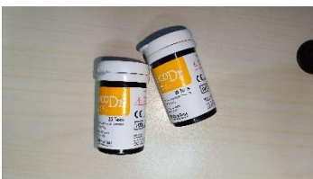
Reagen Stik Glukosa