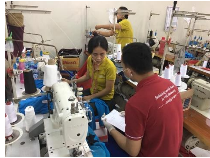
Melakukan wawancara terhadap responden