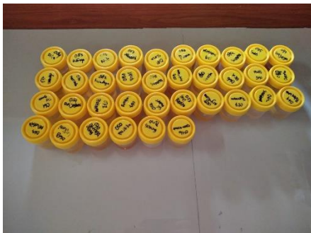
Sampel urine yang akan diperiksa