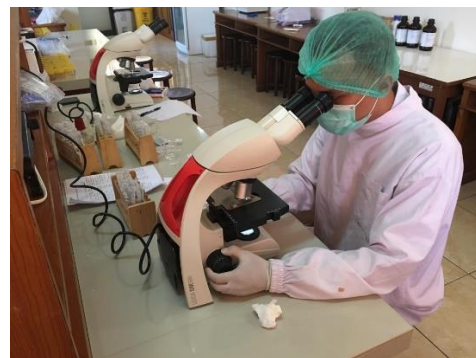
Pengamatan sedimen urine