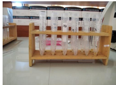
Sampel urine yang sudah disentrifuge