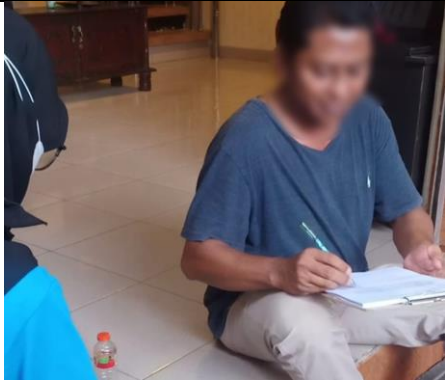
Pemberian Informed Consent