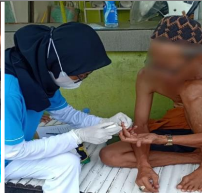
Pemeriksaan Kadar Hemoglobin