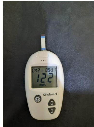
Hasil pemeriksaan kadar glukosa sewaktu tertinggi