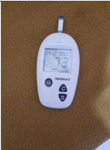
Hasil pemeriksaan kadar glukosa sewaktu terendah