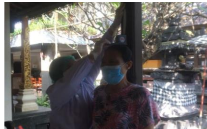
Gambar 6. Mengukur Tinggi Badan Responden