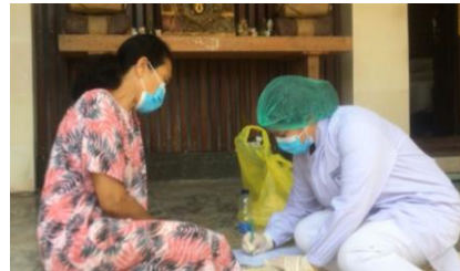
Gambar 4. Proses Wawancara dan Pengisian Lembar Wawancara