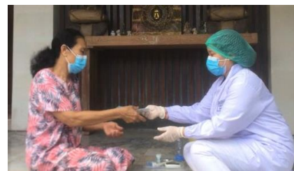
Gambar 8. Pemberian Masker Pada Responden