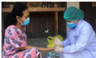
Gambar 7. Pemeriksaan Kadar Glukosa Darah Responden