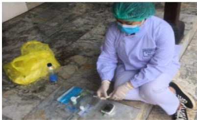
Gambar 3. Mempersiapkan Alat dan Bahan