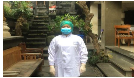
Gambar 2. Memakai APD