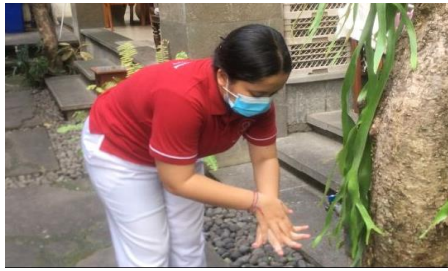
Gambar 1. Mencuci Tangan