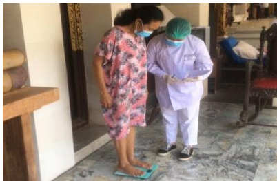
Gambar 5. Menimbang Berat Badan Responden