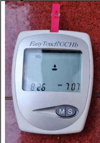
Alat Easy touch GCHb