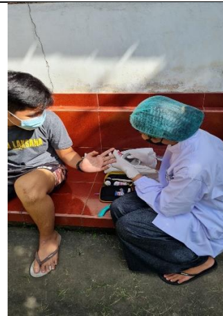
Pemeriksaan kadar hemoglobin