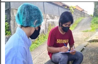
Wawancara dan penandatanganan Informed Consent