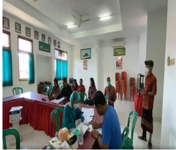
Gambar 12. Penandatanganan inform concent