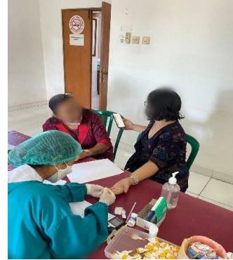
Gambar 14. Proses pengambilan darah kapiler