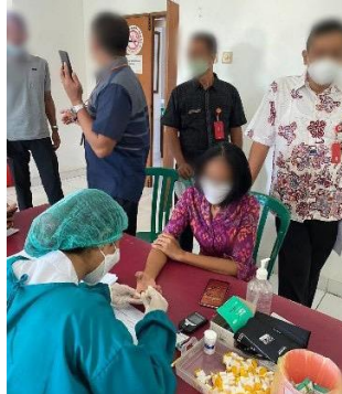
Gambar 13. Proses pengambilan darah kapiler