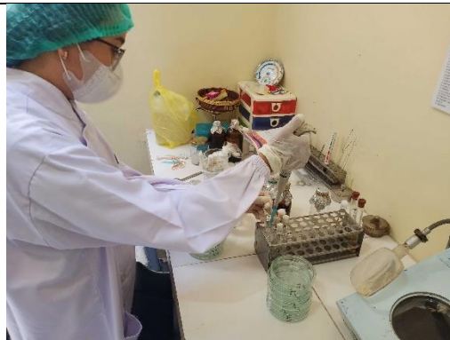
Gambar 13. Pengenceran sampel