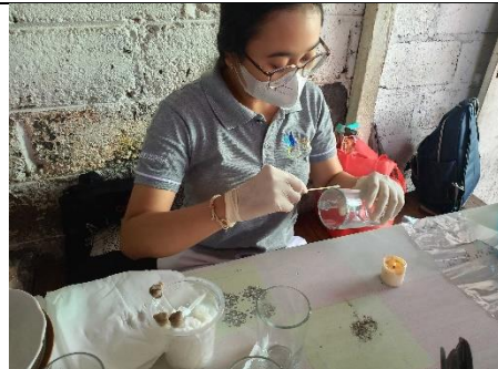
Gambar 8. Usap alat makan gelas