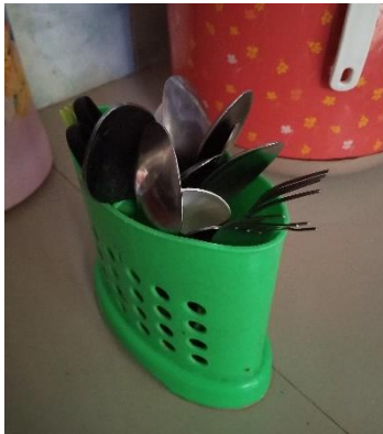
Gambar 3. Penyimpanan sendok garpu