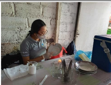
Gambar 7. Usap alat makan piring