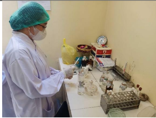
Gambar 11. Persiapan Pemeriksaan