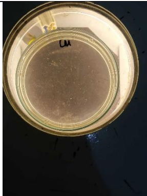
Gambar 17. Kontrol Pemeriksaan