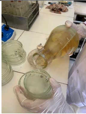
Gambar 15. Penuangan media PCA