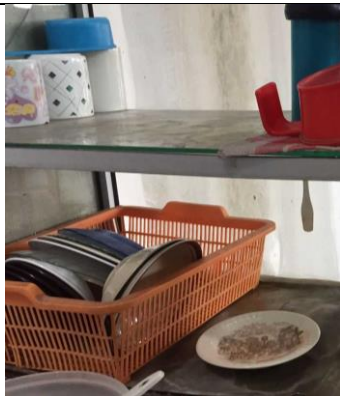
Gambar 5. Penyimpanan piring