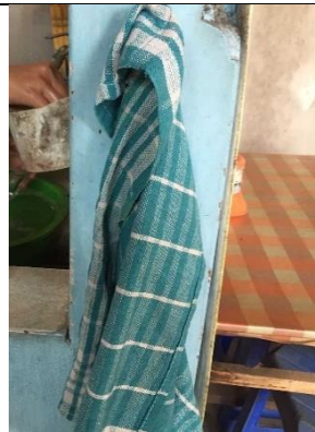
Gambar 6. Lap pengeringan alat makan