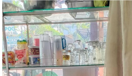
Gambar 4. Penyimpanan gelas