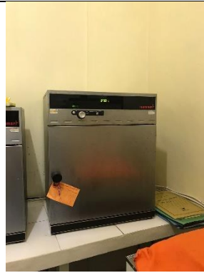
Gambar 16. Inkubasi selama 2x24 jam