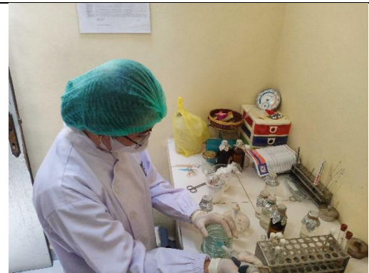
Gambar 14. Pemipetan sampel ke petridish