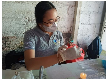
Gambar 10. Usap alat makan garpu