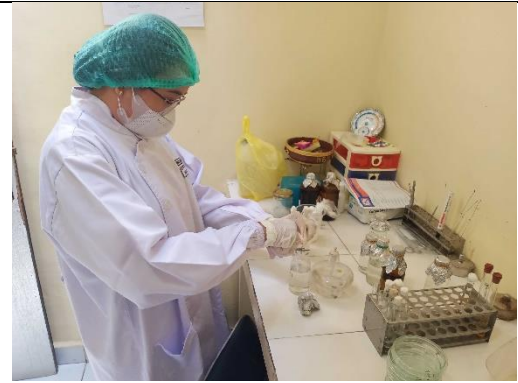
Gambar 12. Memasukkan sampel ke buffer phosphate