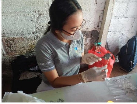
Gambar 9. Usap alat makan sendok