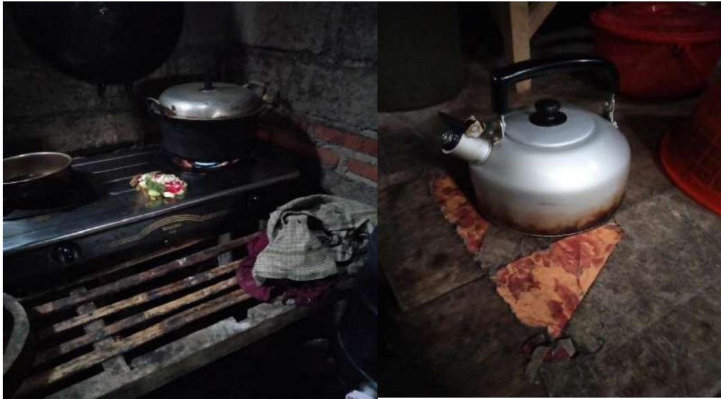
Pengelolaan air minum dengan proses pengolahan, dan wadah penyimpanan tertutup