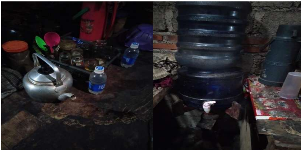
Air minum tanpa proses pengolahan dan tanpa pengelolaan yang benar