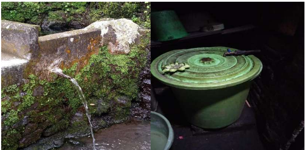
Salah satu sumber mata air dan tempat penyimpanan air