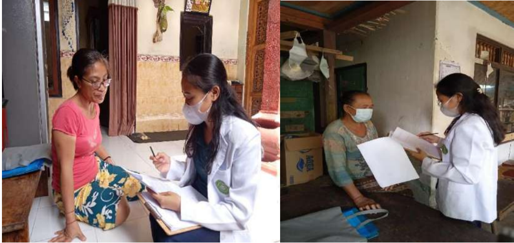
Kegiatan wawancara dengan responden