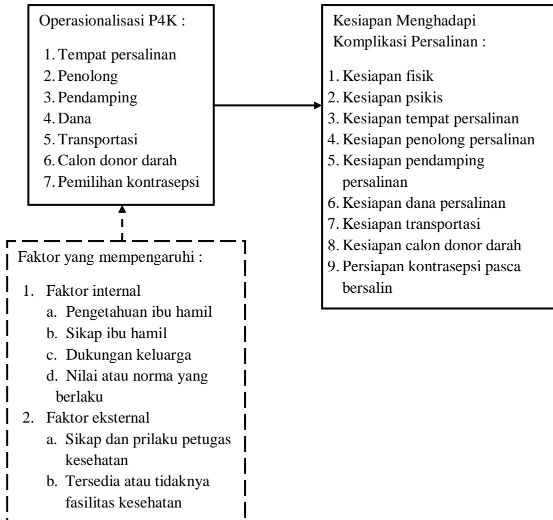
Gambar 1. Kerangka Konsep

Kerangka konsep penelitian ini dapat dilihat pada gambar: