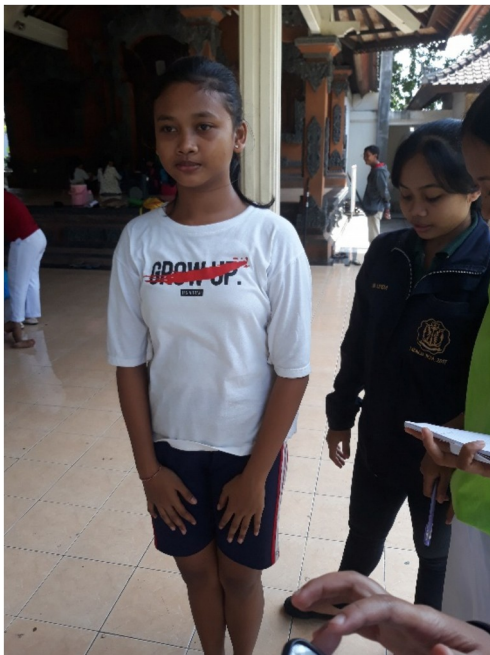
Pengukuran BB dan TB