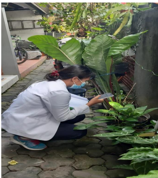
Pemeriksaan jentik pada pot tanaman