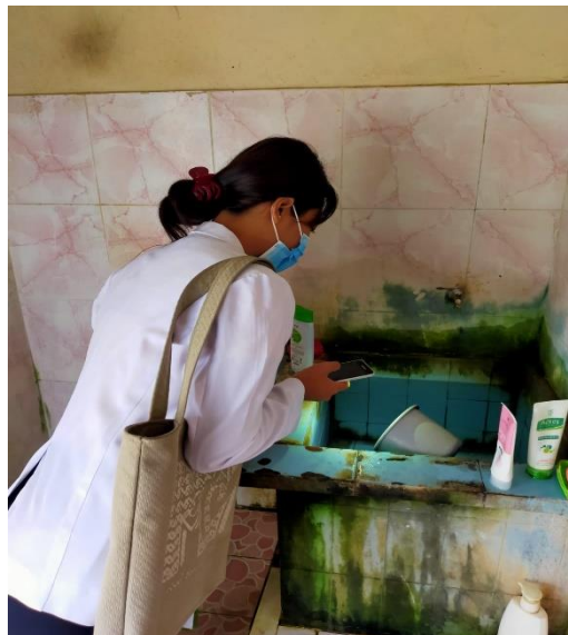
Pemeriksaan keberadaan jentik di bak mandi