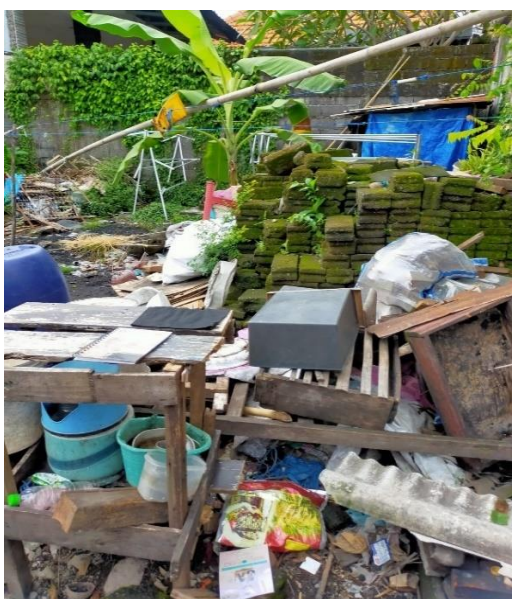
Keadaan lingkungan di salah satu rumah responden