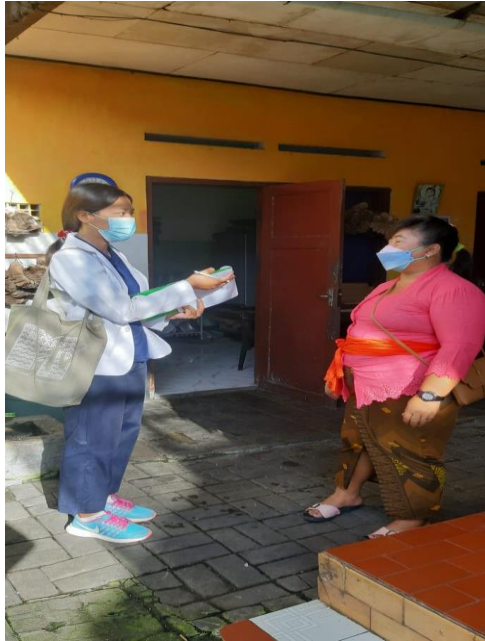
Wawancara dengan salah satu responden