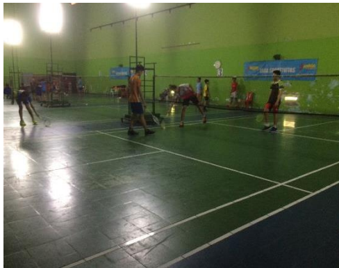
Sesi latihan inti