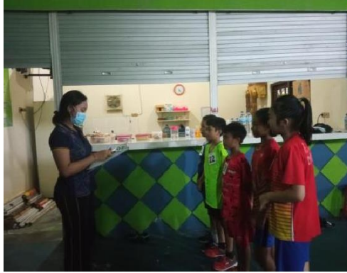
Pembagian nomor dada dan persiapan tes kebugaran fisik