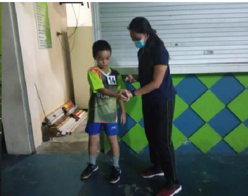
Penghitungan denyut nadi sampel setelah melakukan sesi latihan inti