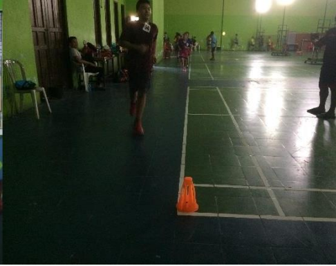
Tes kebugaran fisik