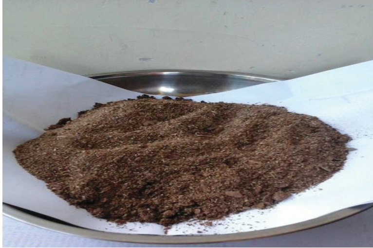
Gambar 1. Ekstrak daun lidah buaya dan daun sirih