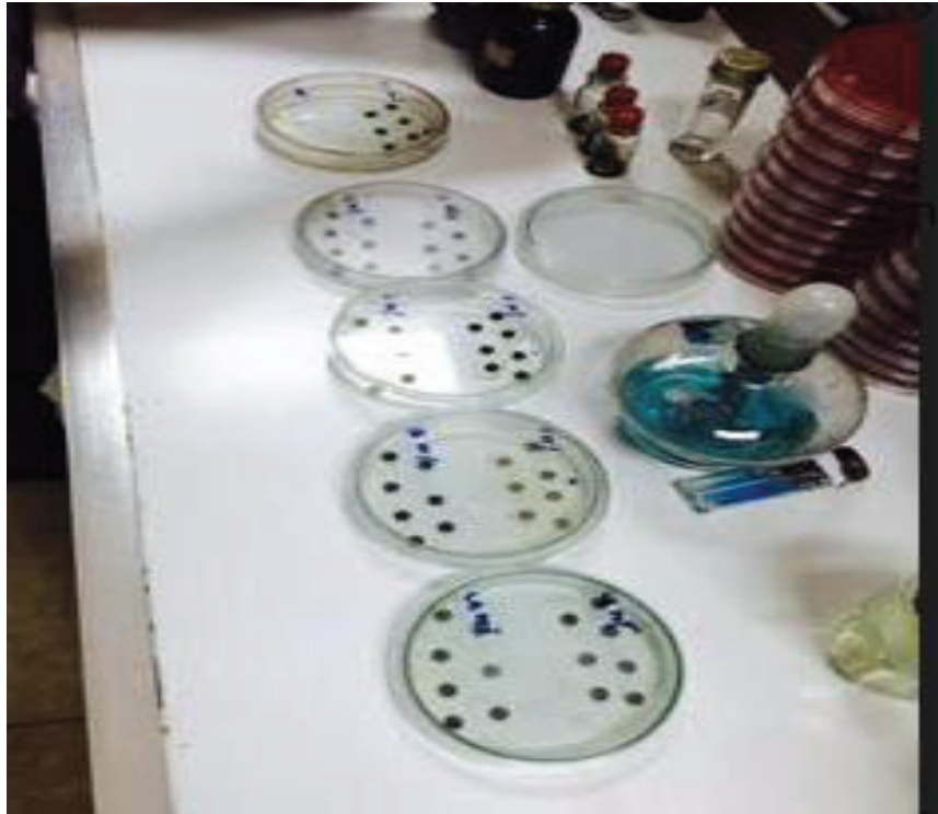
Gambar 3. Daya Hambat Zona Hambat Interaksi Ekstrak Daun Lidah Buaya dan daun Sirih