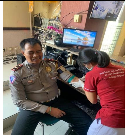
Gambar 2. Proses Pengambilan darah pada polisi