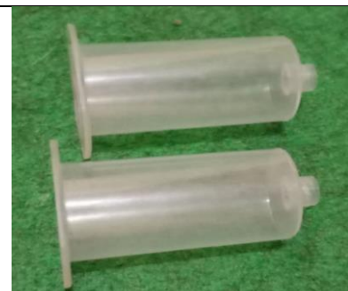
Gambar 6. Holder