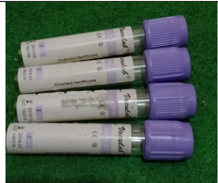
Gambar 4. Tabung EDTA