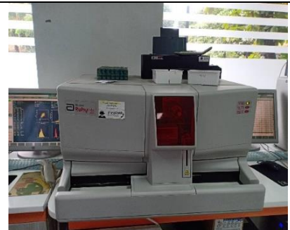
Gambar 12. Automated Hematology CELL-DYN Ruby