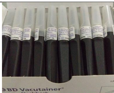
Gambar 5. Jarum Vacum