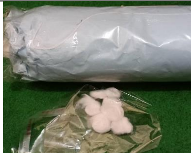
Gambar 9. Kapas Steril Kering