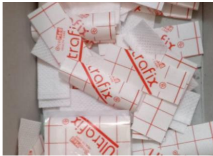
Gambar 7. Hipafix