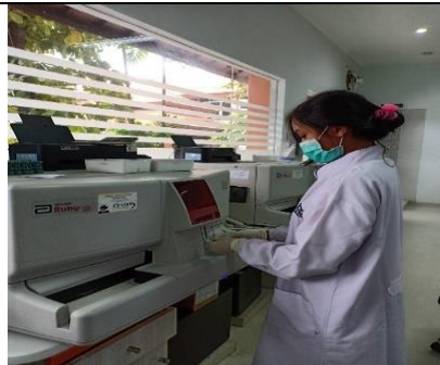
Gambar 11. Pemeriksaan Sampel