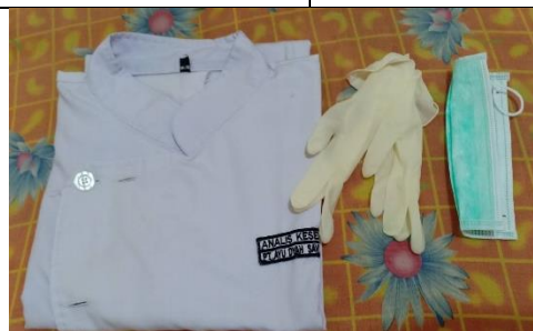
Gambar 13. Alat Perlindungan Diri (masker, handscoone, dan Jas Laboratorium)