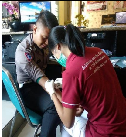
Gambar 1. Persiapan Pengambilan darah dan dilakukan wawancara