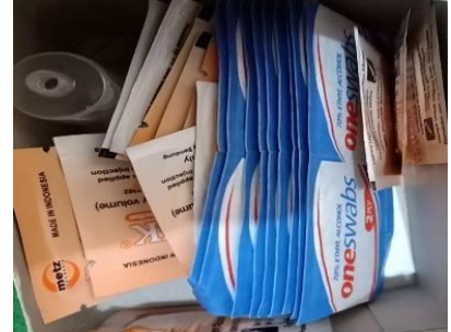
Gambar 8. Alkohol Swab