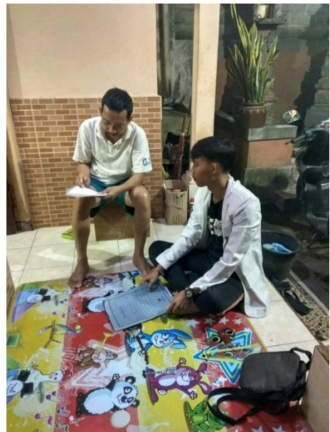
Gambar 2 Kegiatan wawancara dengan responden