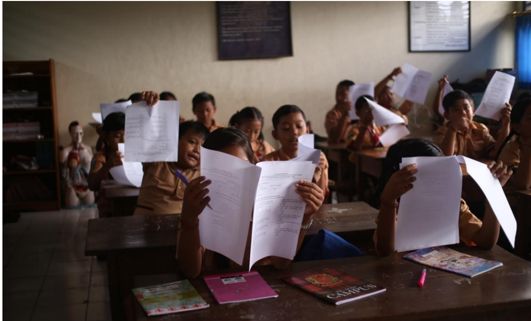
Pengarahan untuk pengisian kuisisioner