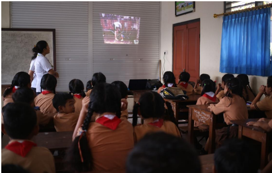
Pada saat penayangan video