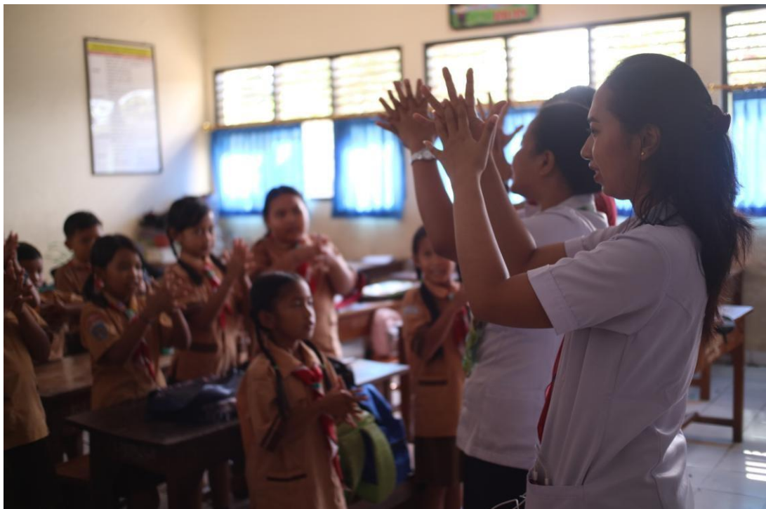
Mempraktikan cuci tangan di dalam kelas