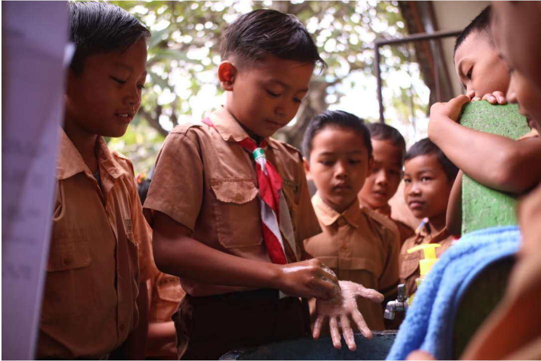
Pratik cuci tangan diluar kelas