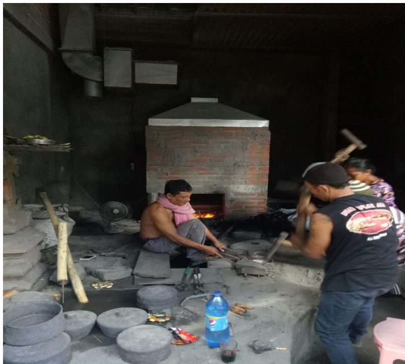
Salah Satu Prapen yang Menggunakan Cerobong Asap dan Para Tenaga Kerja Melakukan Proses Penempaan