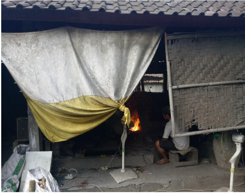
Kondisi Salah Satu Lokasi Penelitian