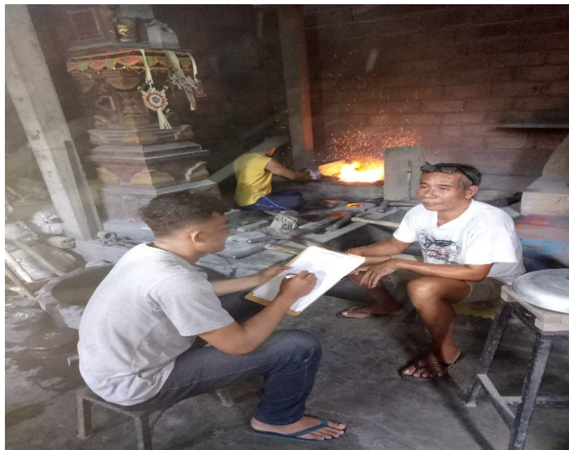
Wawancara dengan Salah Satu Tenaga Kerja