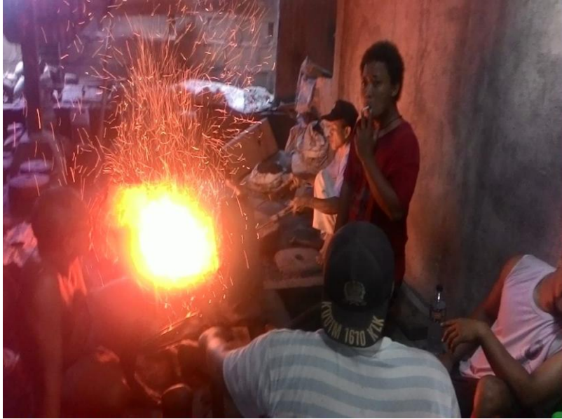
Kondisi Salah Satu Prapen Terlihat Para Pekerja Tidak Ada yang Menggunakan APD dan Salah Satu Pekerja Merokok Saat Bekerja