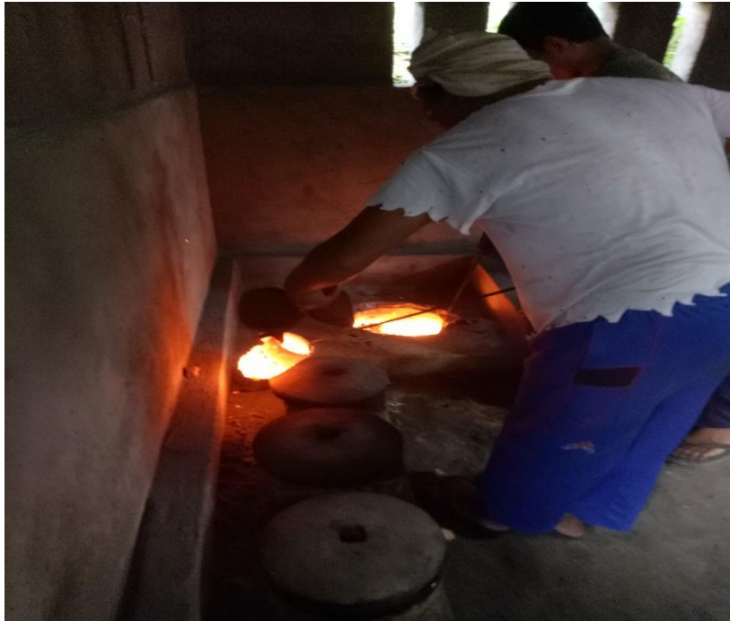
Tenaga Kerja Yang Melakukan Proses Pencetakan