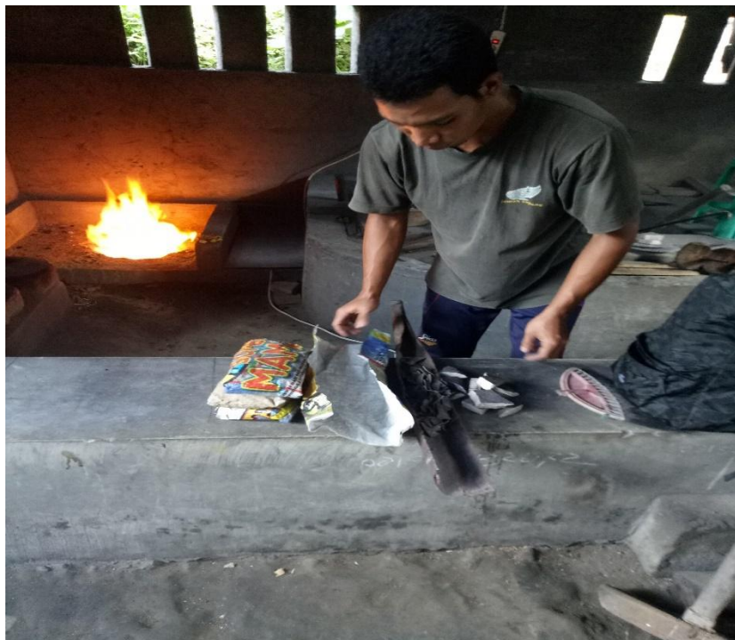
Salah Satu Tenaga Melakukan Proses Peleburan Bahan Baku