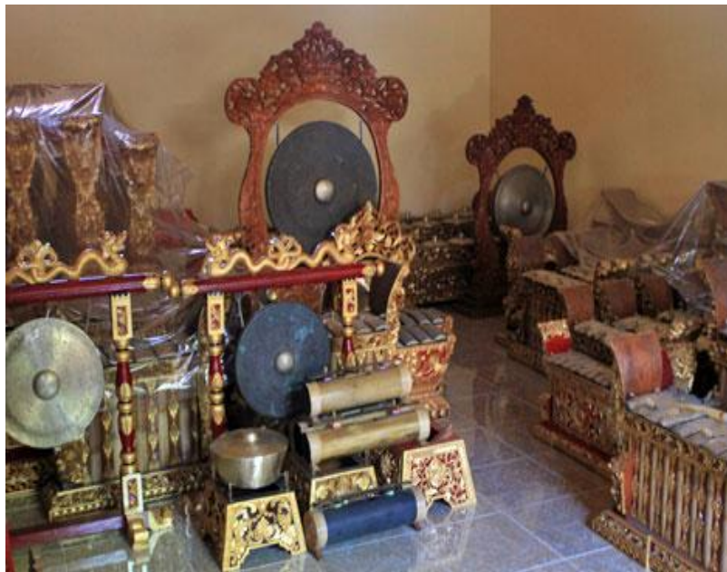
Hasil Gamelan yang Sudah Jadi