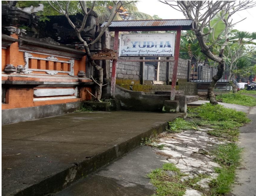
Salah Satu Industri Gamelan Bali yang Dilakukan Penelitian