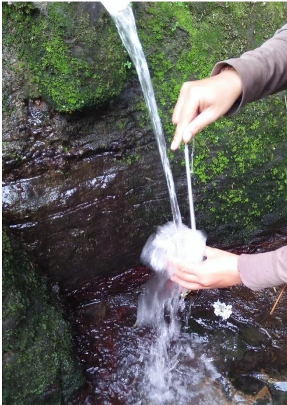
Melakukan pengukuran suhu air Taman Beji Desa Ubung Kaja Denpasar