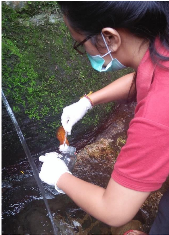
Melakukan fiksasi terhadap botol sampel air