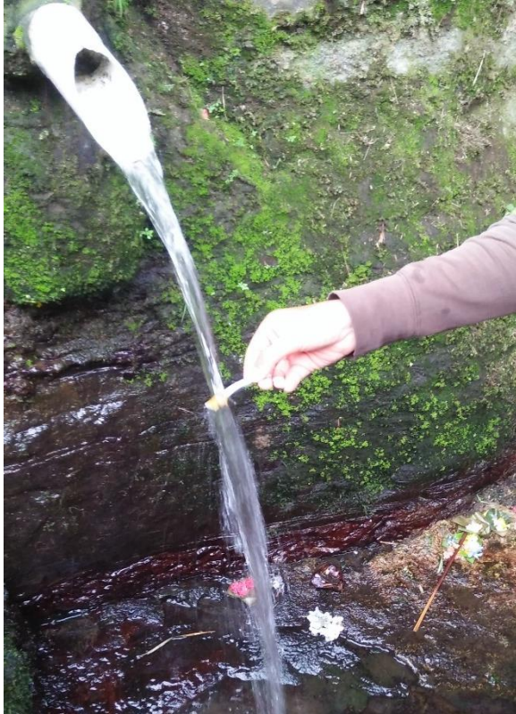
Melakukan pengukuran pH air Taman Beji Desa Ubung Kaja