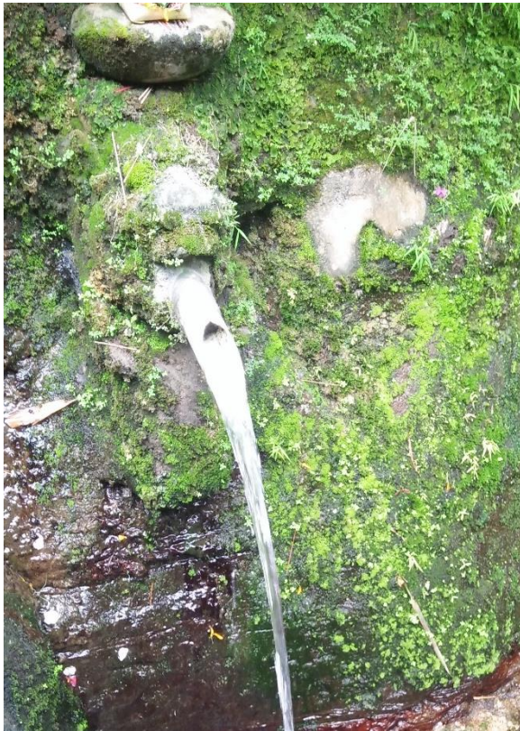
Keadaan sekitar pancoran mata air Taman Beji Desa Ubung Kaja