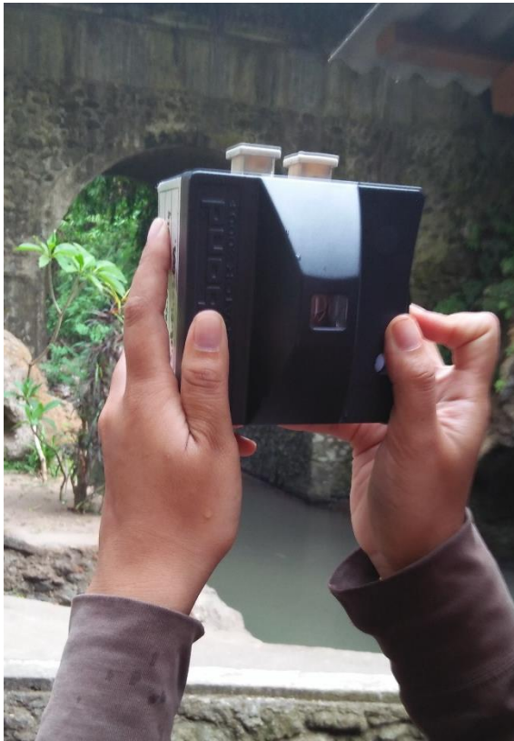
Melakukan pengukuran kesadahan air Taman Beji Desa Ubung Kaja