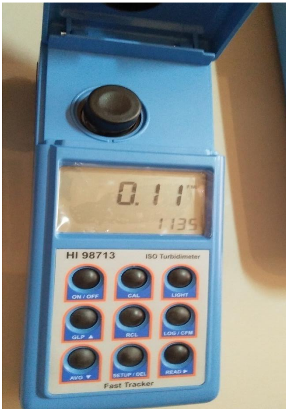
Melakukan pengukuran kekeruhan air Taman Beji Desa Ubung Kaja