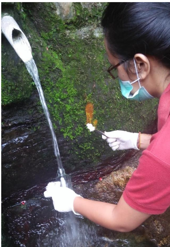
Mengambil sampel air Taman Beji Desa Ubung Kaja