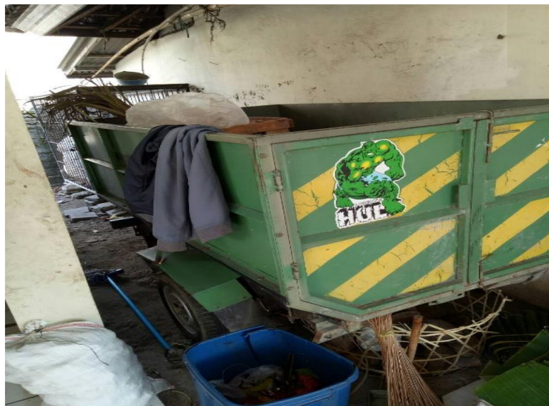
Pengangkutan menggunakan sarana motor cikal