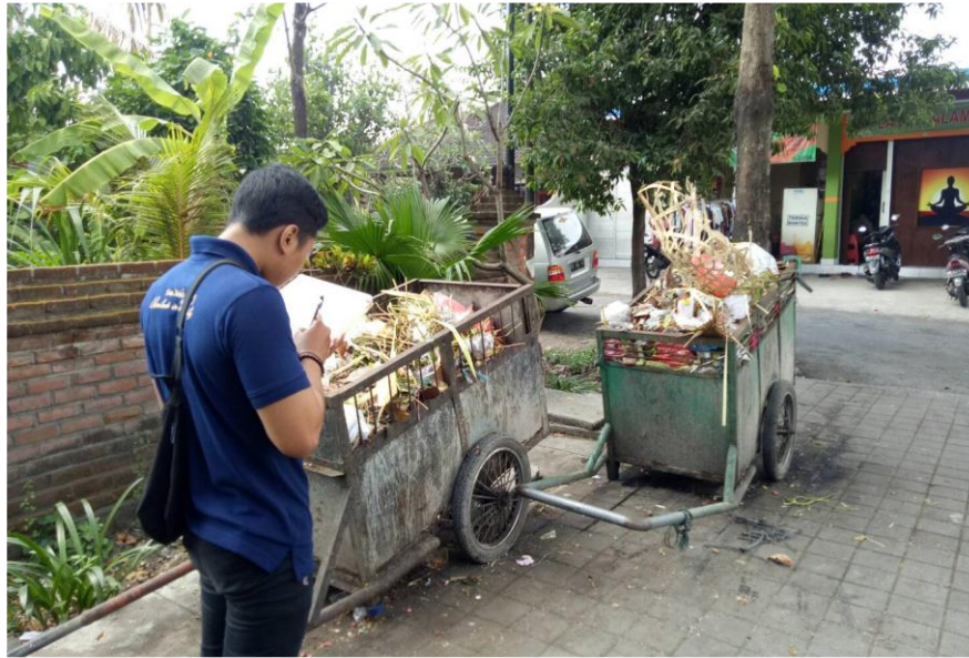
Saat melakukan pengamatan gerobak yang digunakan sebagai TPS