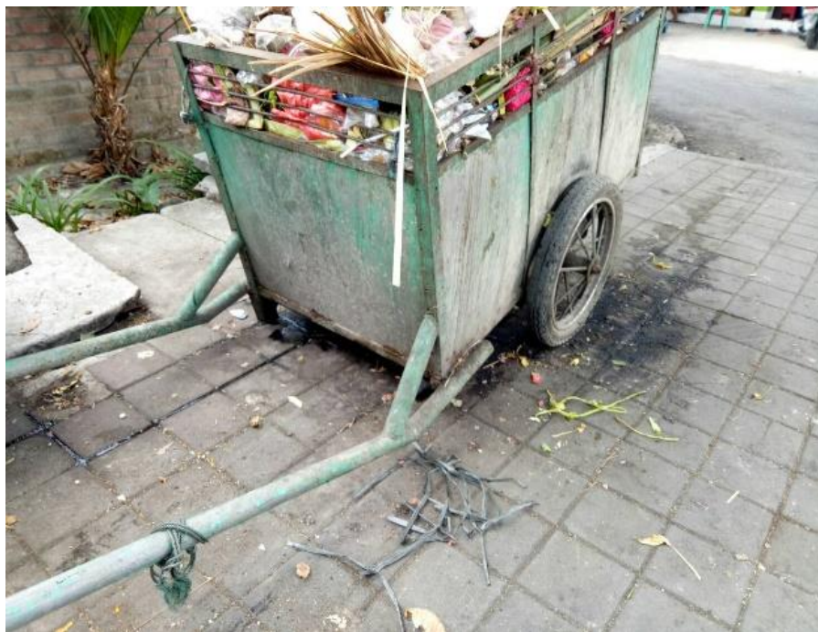
Terdapat ceceran air lindi dan sampah berserakan pada TPS