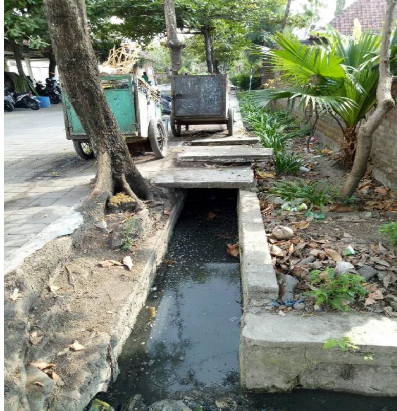
Terlihat bahwa TPS tepat berada di atas selokan got