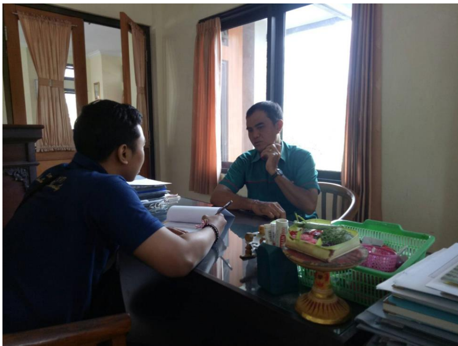
Saat melakukan wawancara bersama Bapak Kepala Pasar Desa Nyanggelan