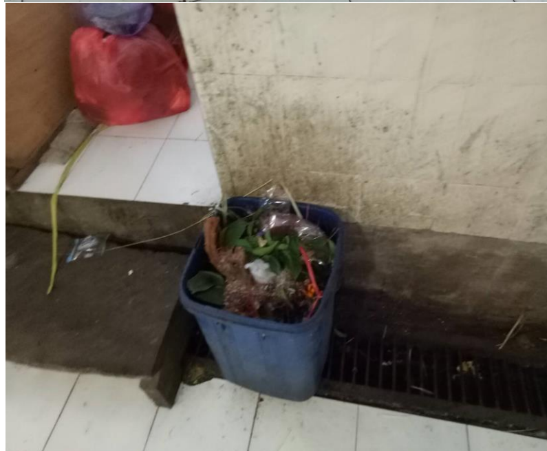
Tong sampah tiap kios dan los ada yang memiliki tutup dan tidak memiliki tutup.