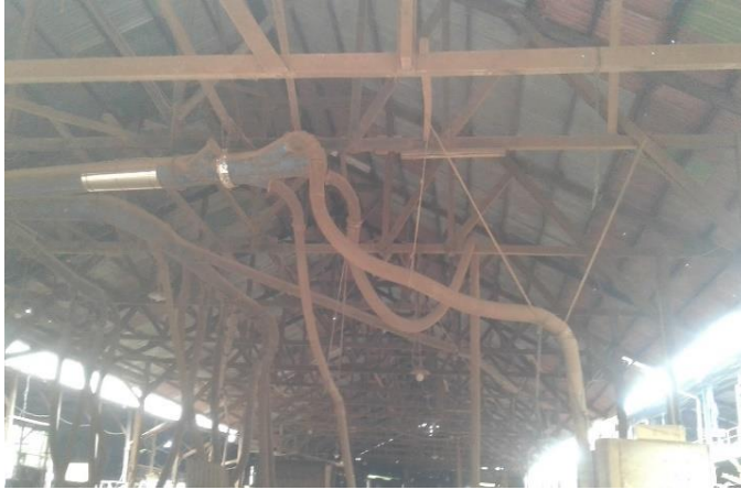
Bagian Atap Tempat Kerja Pengrajin Kayu di CV. Mertanadi