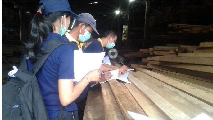
Pengisian Kuesiner oleh Pekerja Pengrajin Kayu di CV. Mertanadi