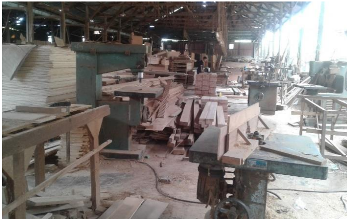
Tempat Kerja Pengrajin Kayu di CV. Mertanadi