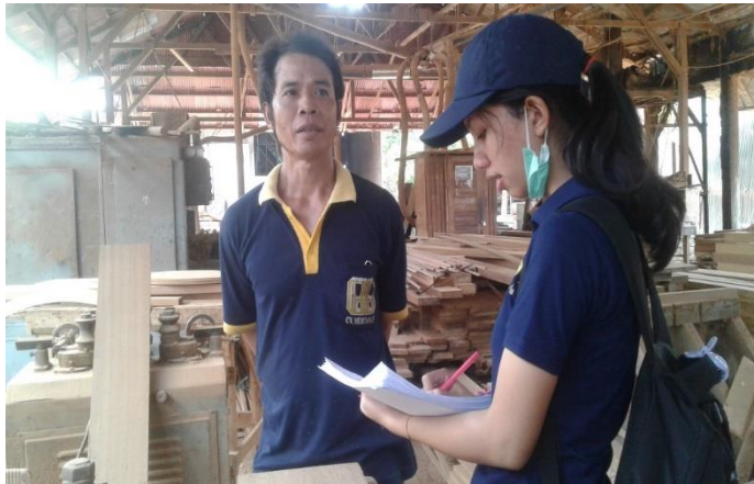
Wawancara Langsung dengan Pekerja Pengrajin Kayu CV. Mertanadi