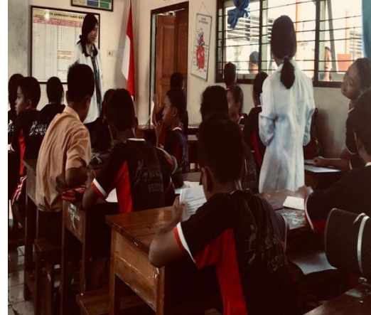
Kegiatan pengarahan dan pengisian kuesioner pengetahuan cuci tangan pakai sabun