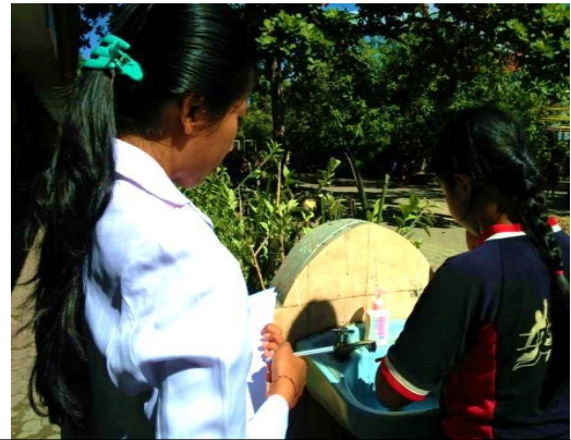
Kegiatan observasi pelaksanaan praktek cuci tangan pakai sabun