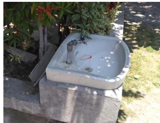
Keadaan sarana cuci tangan di SD Negeri 14 Sesetan