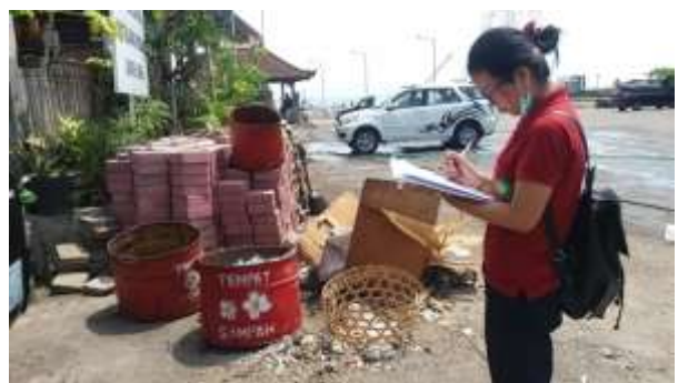
Kondisi tempat pembuangan sampah di Pasar Desa Adat Kedongan