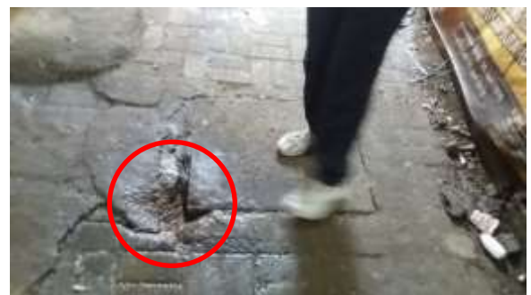
Terdapat lubang pada bagian saluran limbah