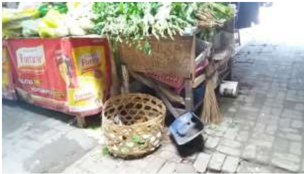
Tempat penampungan sampah sementara pada kios berupa keranjang