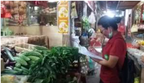
Saat melakukan penilaian dengan menggunakan lembar observasi