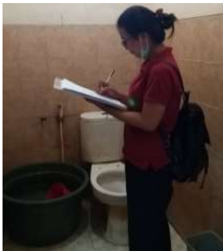
Kondisi di toilet umum pasar