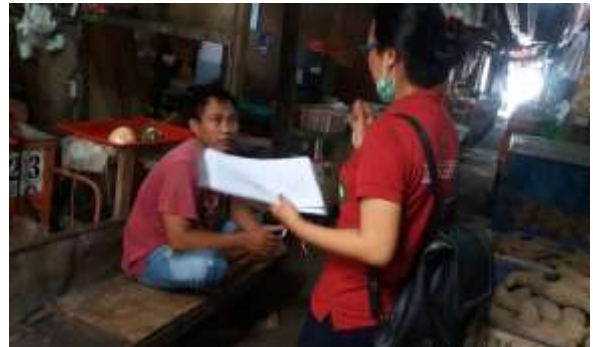
Saat melakukan wawancara pada salah satu pedagang di pasar