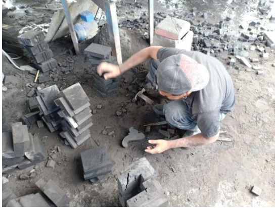
Proses pemahatan batu padas