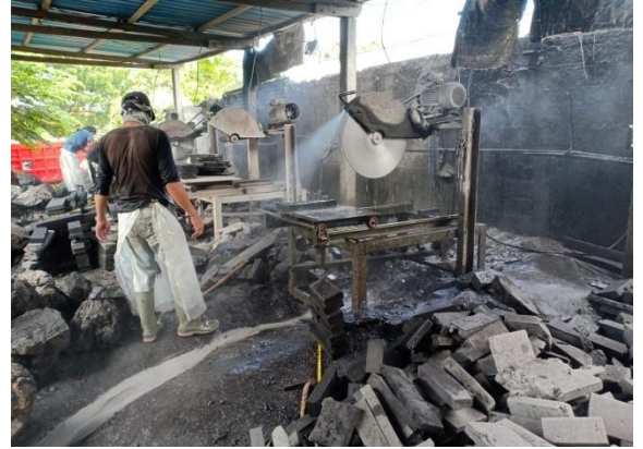
proses pemotongan batu padas