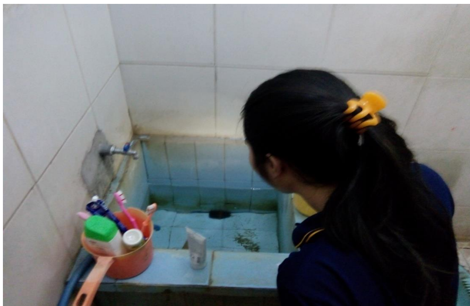
Pengamatan Keberadaan Jentik Di Tempat Penampungan Air/ Bak Mandi