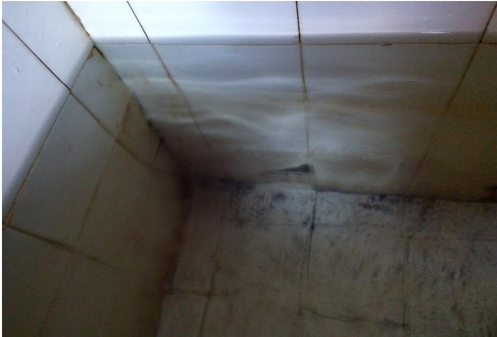
Pengamatan Keberadaan Jentik Di Tempat Penampungan Air Yang Positif Jentik