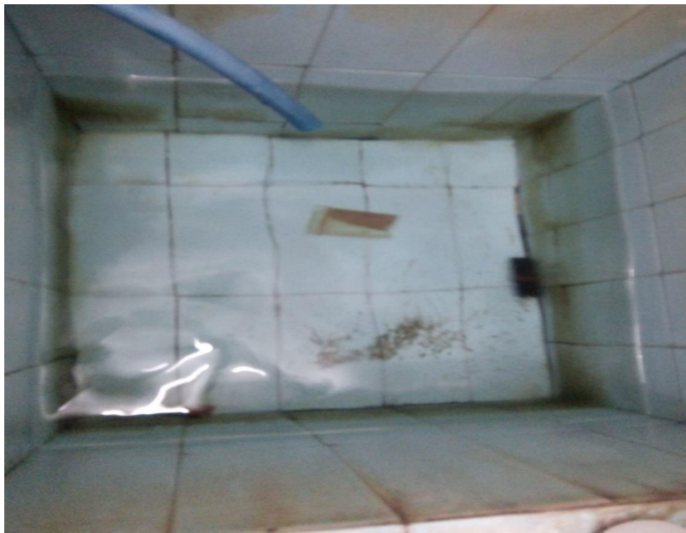
Pengamatan Keberadaan Jentik Di Tempat Penampungan Air Yang Negatif Jentik