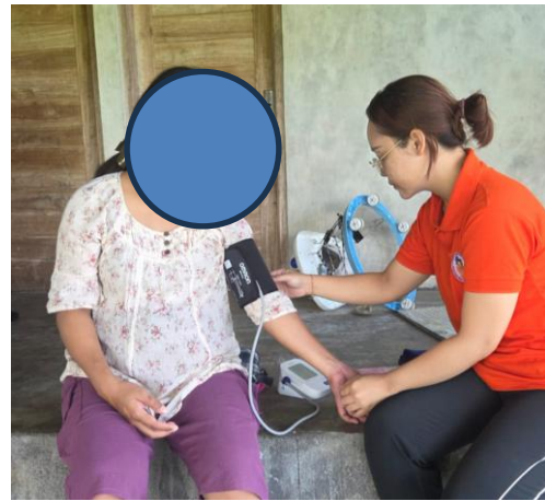
Gambar 2. Pemeriksaan Ibu