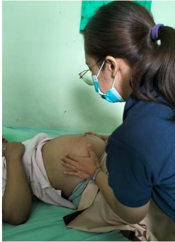
Gambar 1. Pemeriksaan Ibu Hamil Hamil