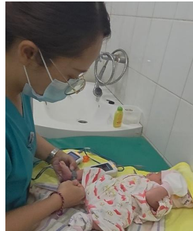
Gambar 8. Pemeriksaan PJB