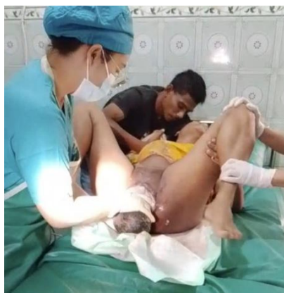
Gambar 5. Persalinan