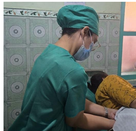
Gambar 4. Counter Pressure massage