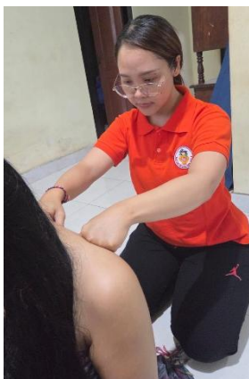
Gambar 11 . Pijat Oksitosin