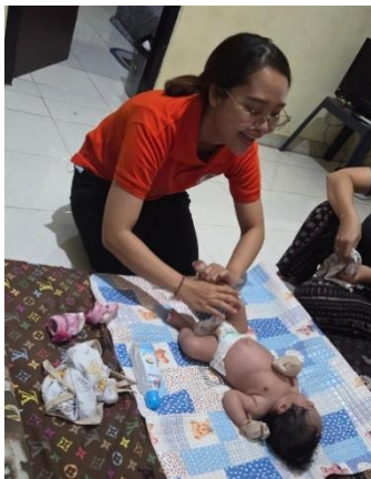
Gambar 9. Pijat Bayi