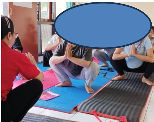
Gambar 3. Prenatal Yoga dan Kelas ibu hamil