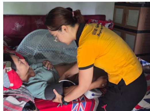
Gambar 10. Kunjungan Nifas