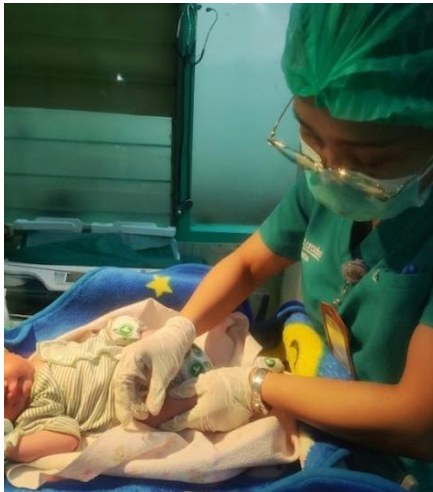
Gambar 7. Asuhan BBL