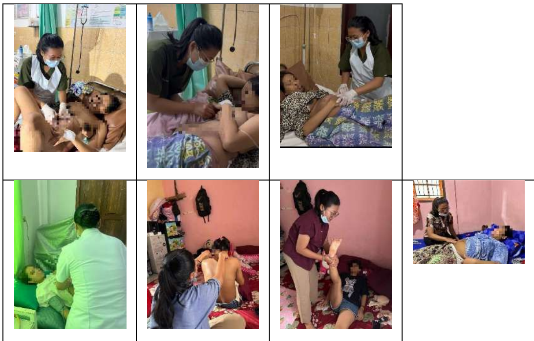
Dokumentasi ibu nifas