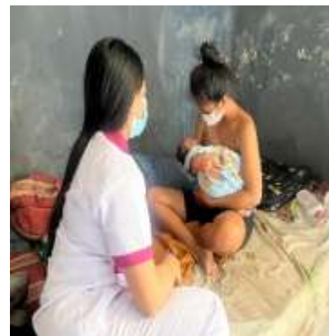
Mengajari ibu cara menyusui