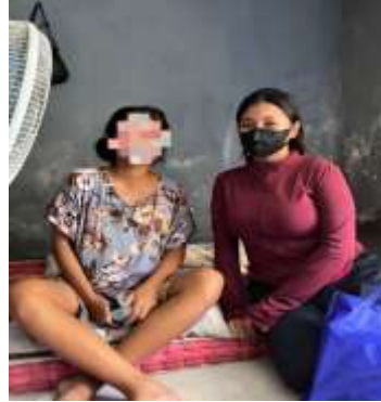
Melakukan Kunjungan Kehamilan 2