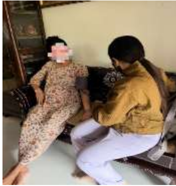
Melakukan Kunjungan Kehamilan 1