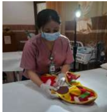
Melakukan pemeriksaan fisik pada bayi