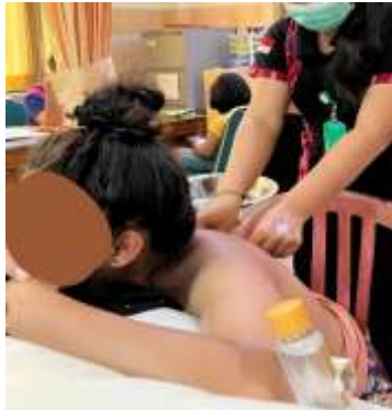
Melakukan pijat oksitosin