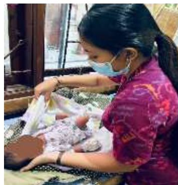
Melakukan Kunjungan Nenonatus