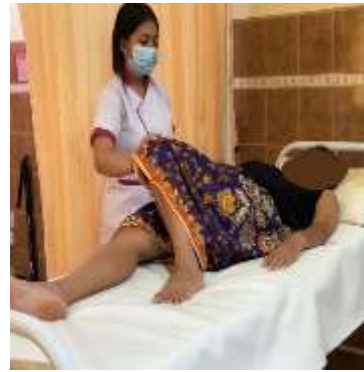
Melakukan senam nifas