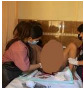
Melakukan PTT dan melahirkan plasenta