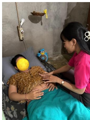
KF3 dan KN3