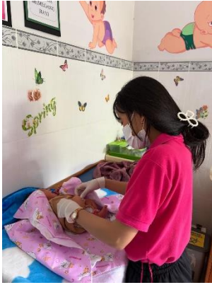
Kunjungan Neonatus Pertama