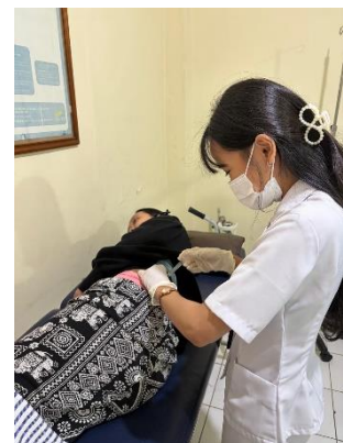
KB Suntik 3 Bulan