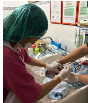
Perawatan Bayi Baru Lahir