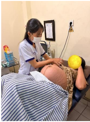
Kunjungan Antenatal Care