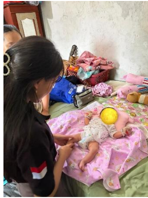
Asuhan Komplementer Pijat Bayi