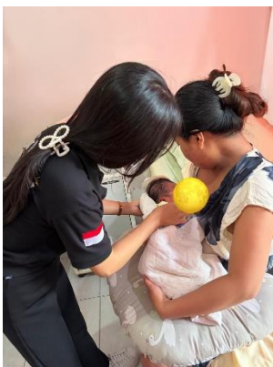
KF2 dan KN2