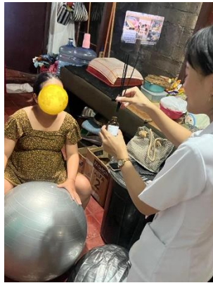
Asuhan Komplementer Aromaterapi