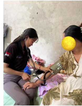
Kunjungan Nifas Keempat