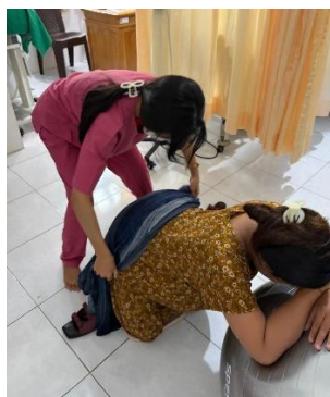
Asuhan Komplementer Teknik Rebozo