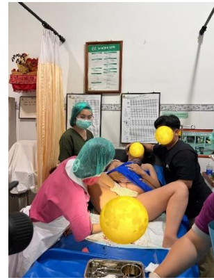
Asuhan Persalinan Normal