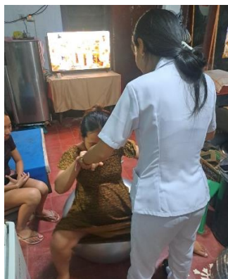
Asuhan Komplementer Gym Ball