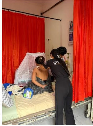
Asuhan Komplementer Pijat Oksitosin