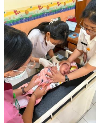
Imunisasi BCG dan Polio Tetes 1