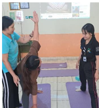
Melakukan Kelas Ibu Hamil