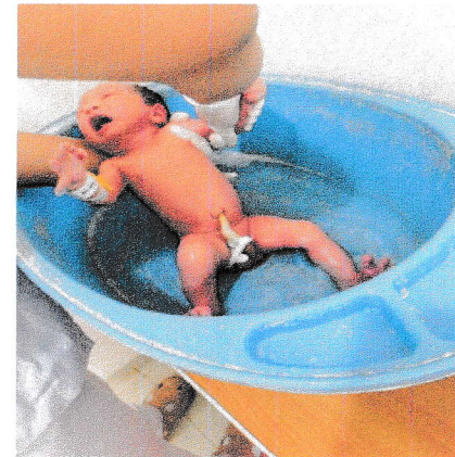
Jumat, 24 April 2026