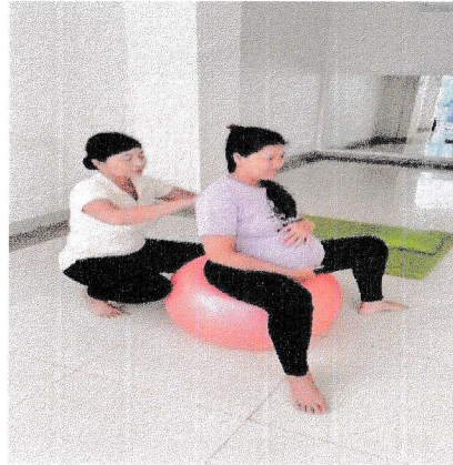
Rabu, 7 Januari 2026