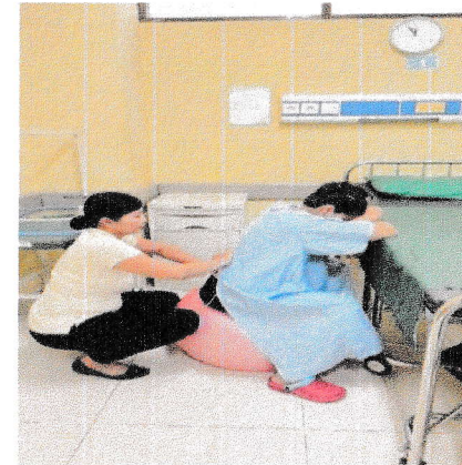
Sabtu, 7 Februari 2026