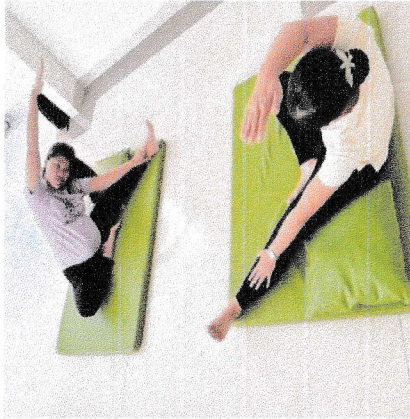
Senin, 7 Desember 2025