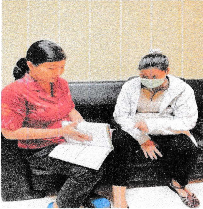
Senin, 23 Maret 2026