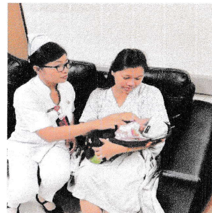
Selasa, 17 Maret 2026